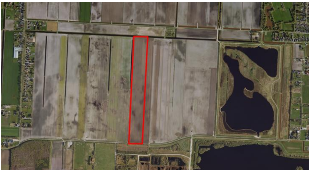
Figuur 1. percelen ontheffing

Wij hebben besloten op basis van onderstaande motivering aan u een ontheffing te verlenen op basis van artikel 3.3 van de Wet natuurbescherming (Wnb) voor het doden van grauwe ganzen met behulp van geweer ter ondersteuning van de aangebrachte preventieve middelen vanaf één uur voor zonsopkomst ter voorkoming van belangrijke schade aan kwetsbare gewassen op de percelen uit uw aanvraag zoals weergegeven op onderstaande figuur 1.