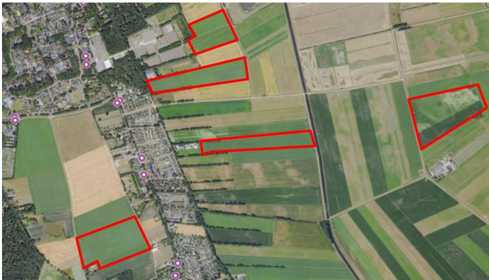
Figuur 1. percelen ontheffing

Wij hebben besloten op basis van onderstaande motivering aan u een ontheffing te verlenen op basis van artikel 3.3 van de Wet natuurbescherming (Wnb) voor het doden van grauwe ganzen met behulp van geweer ter ondersteuning van de aangebrachte preventieve middelen vanaf één uur voor zonsopkomst ter voorkoming van belangrijke schade aan kwetsbare gewassen op de percelen uit uw aanvraag zoals weergegeven op onderstaande figuur 1.