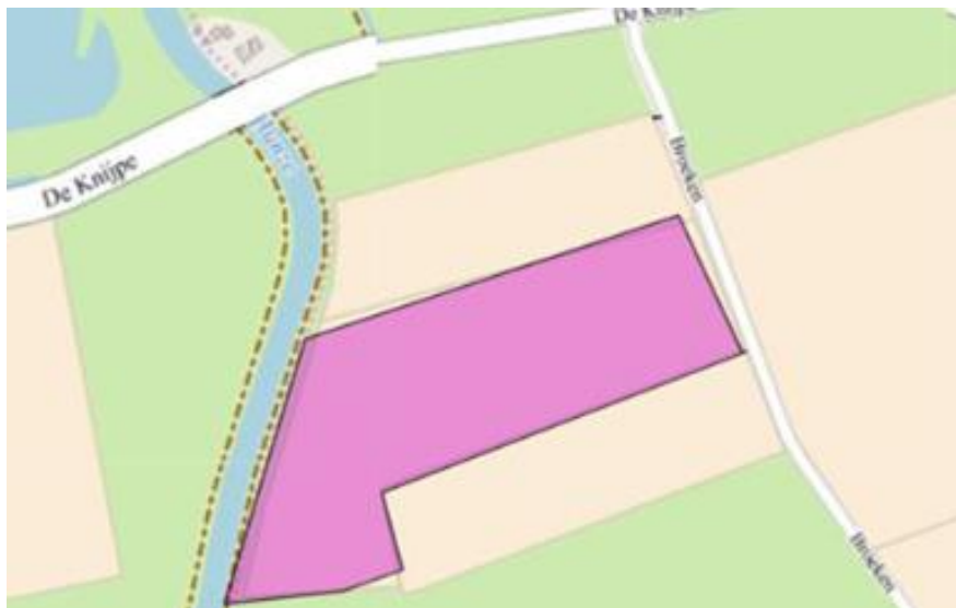
Figuur 1. percelen ontheffing

Wij hebben besloten op basis van onderstaande motivering aan u een ontheffing te verlenen op basis van artikel 3.3 van de Wet natuurbescherming (Wnb) voor het doden van grauwe ganzen met behulp van geweer ter ondersteuning van de aangebrachte preventieve middelen vanaf één uur voor zonsopkomst ter voorkoming van belangrijke schade aan kwetsbare gewassen op de percelen uit uw aanvraag zoals weergegeven op onderstaande figuur 1.