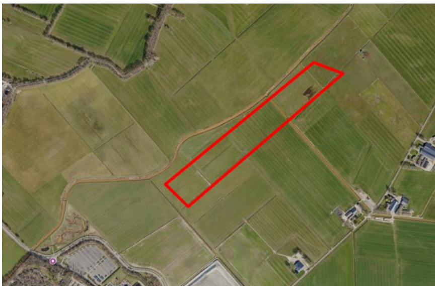
Figuur 1. percelen ontheffing

Wij hebben besloten op basis van onderstaande motivering aan u een ontheffing te verlenen op basis van artikel 3.3 van de Wet natuurbescherming (Wnb) voor het doden van grauwe ganzen met behulp van geweer ter ondersteuning van de aangebrachte preventieve middelen vanaf één uur voor zonsopkomst ter voorkoming van belangrijke schade aan kwetsbare gewassen op de percelen uit uw aanvraag zoals weergegeven op onderstaande figuur 1.