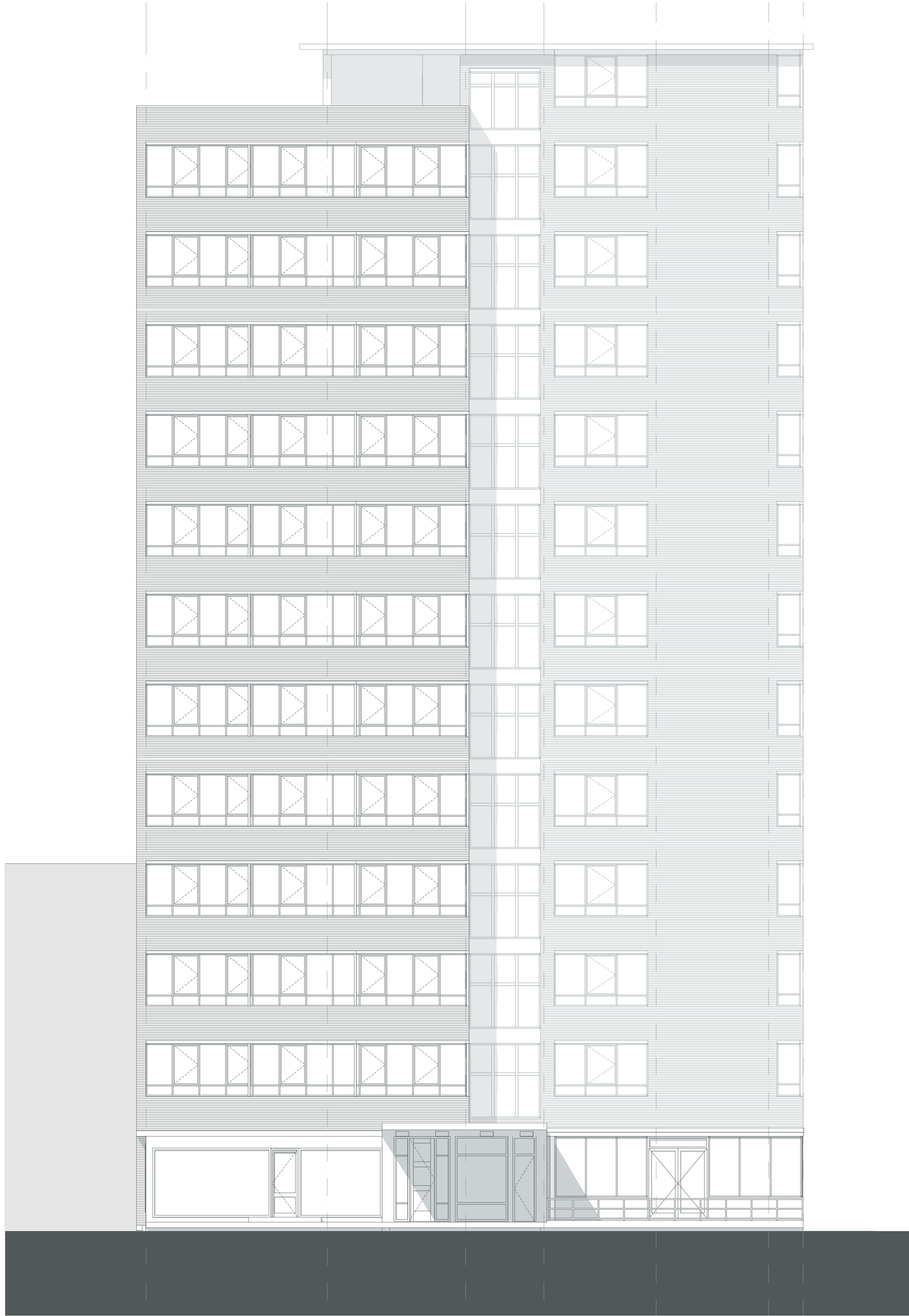
Zuid-Oost gevel 1:100