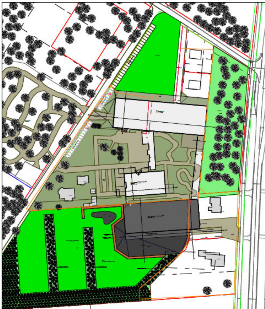
Tekening projectlocatie beoogde situatie