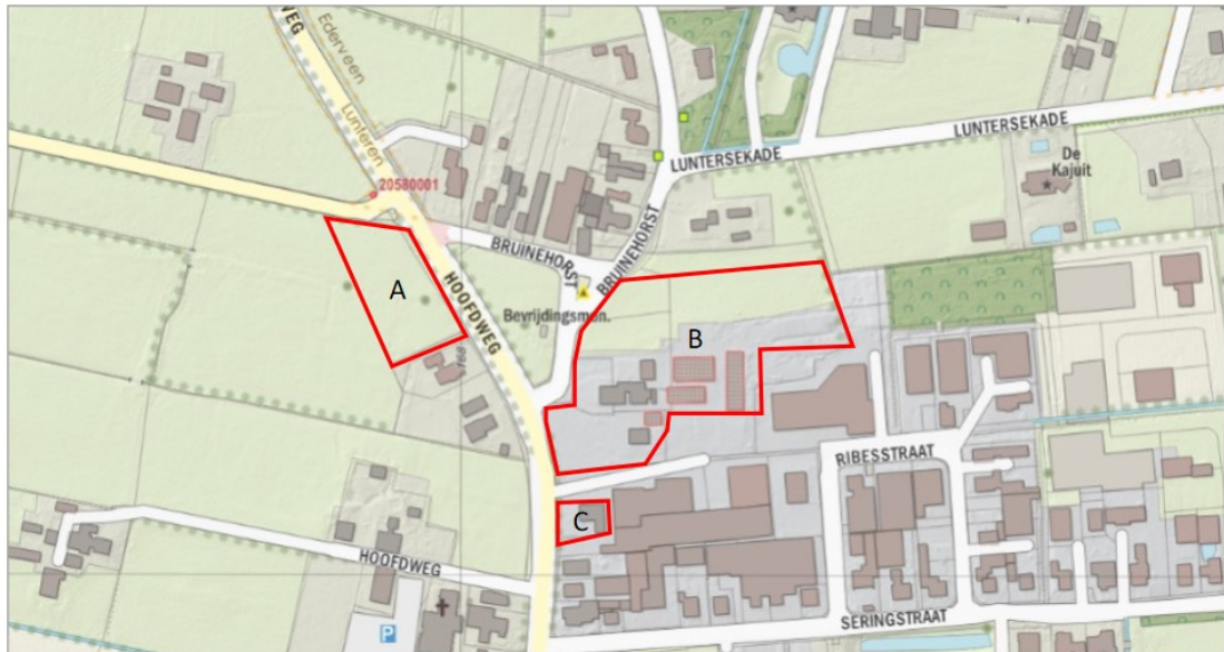
Figuur 1 Locatie plangebied