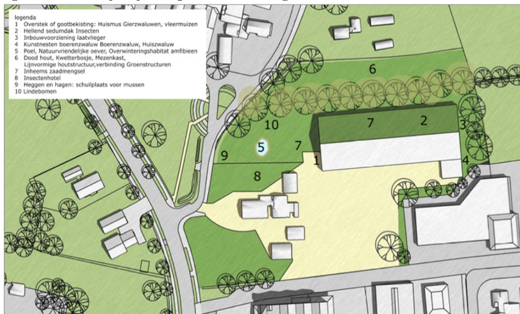
Figuur 2 Natuur inclusieve maatregelen die genomen worden