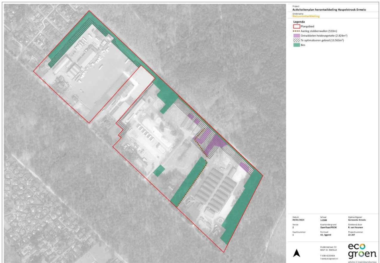
Figuur 1. Mitigerende maatregelen.