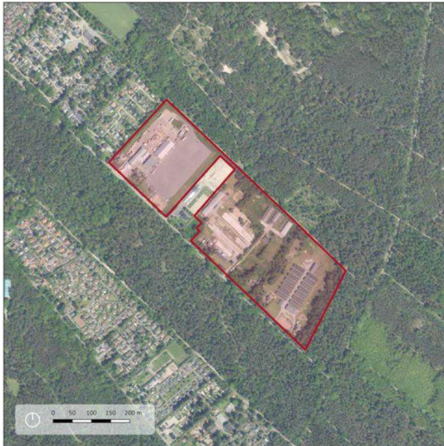
Figuur 2. Luchtfoto projectgebied.