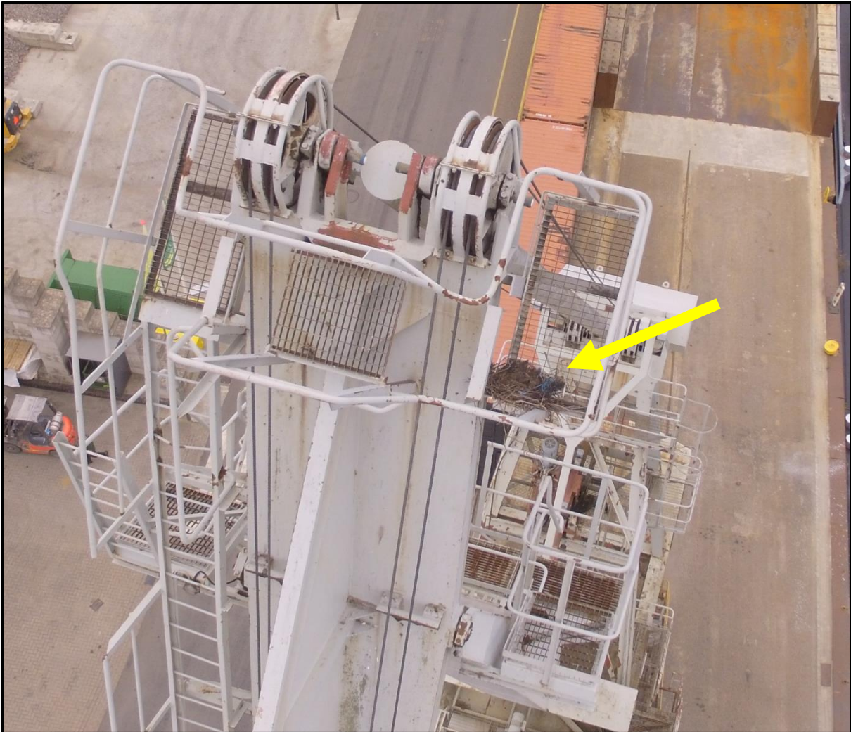
Figuur 3 Locatie van het oude kraaiennest.