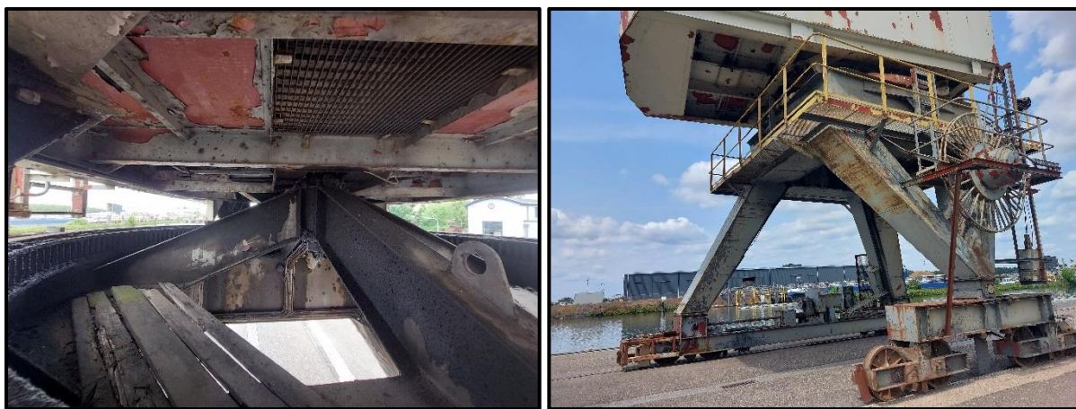
Figuur 2 Situatie van het plangebied ten tijde van het veldbezoek d.d. 30 juni 2023.