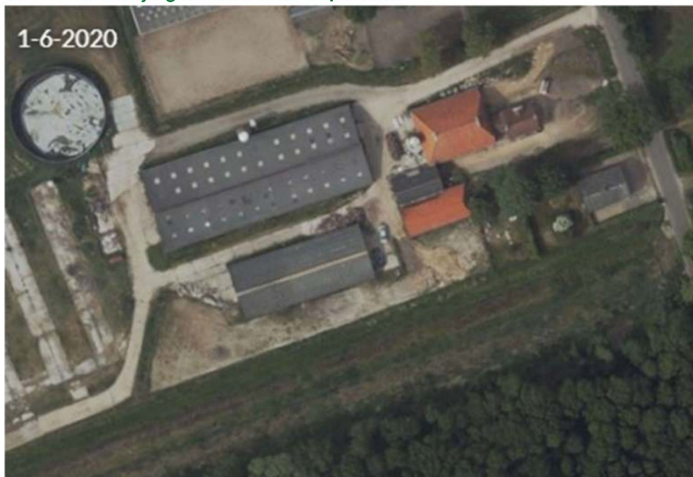
Afbeelding 3: luchtfoto saldogever Zuideinde 32 te Fochteloo