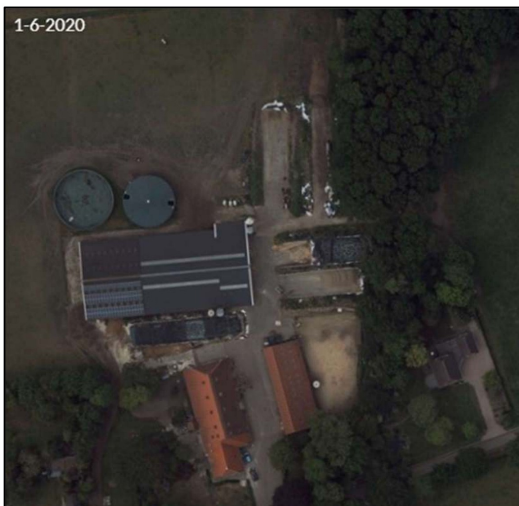
Afbeelding 1: luchtfoto projectlocatie Rijweg 121 te Oosterwolde

De veehouderij is gelegen aan de Rijweg 121 te Oosterwolde. Op het perceel is een agrarisch bedrijf gevestigd waar melkrundvee met bijbehorend jongvee wordt gehouden