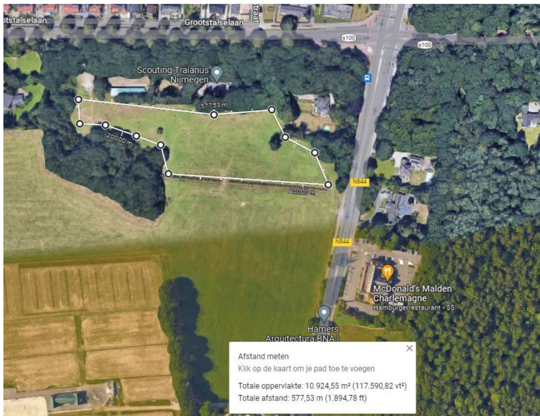
Figuur 2: ligging herplantlocatie nabij Scouting Traianus Nijmegen, kadastraal perceel: Heumen, sectie A, nummer 1080.