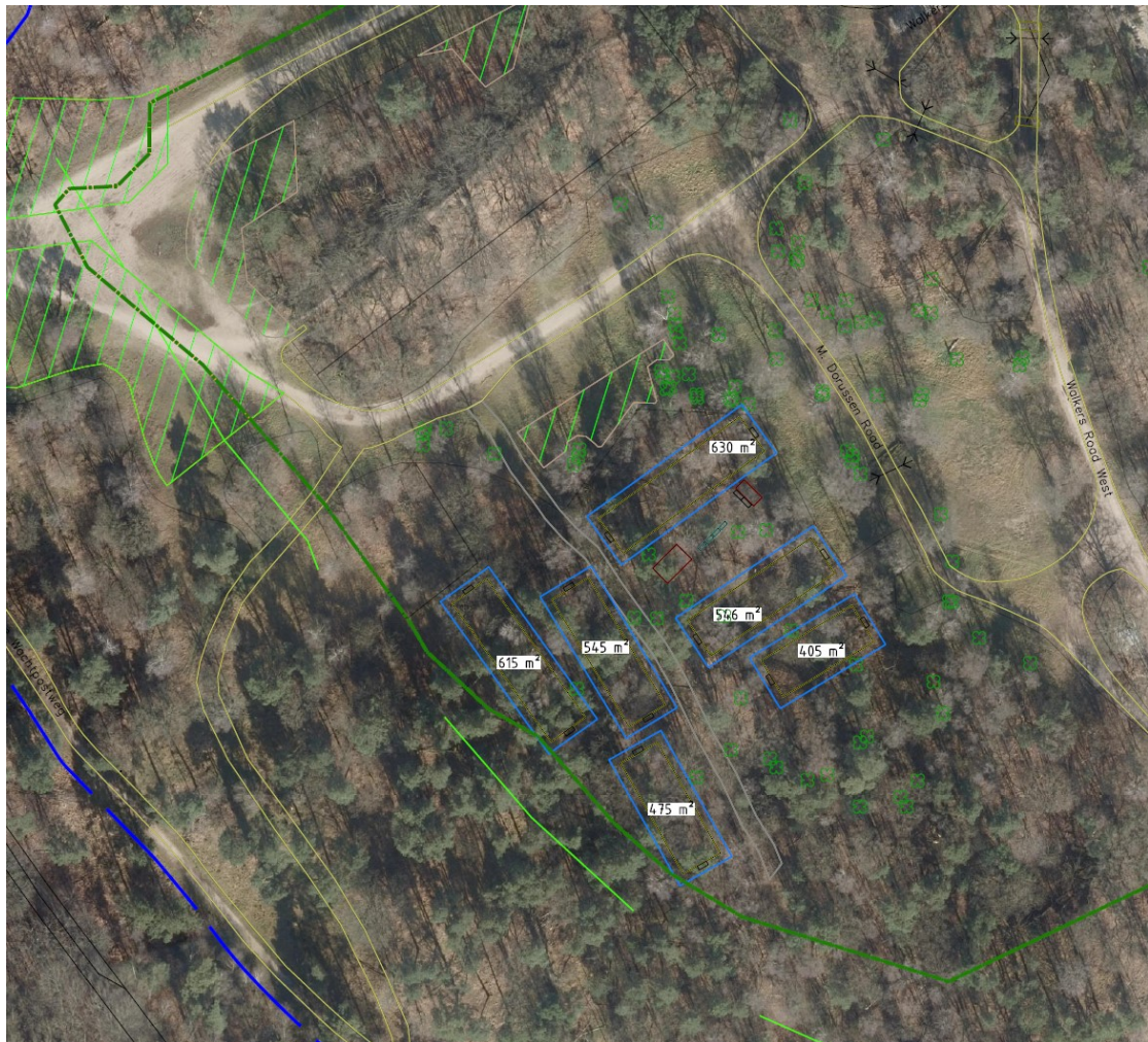
Figuur 1: Ligging kaplocatie, kadastraal perceel: Heumen, sectie B, nummer 577