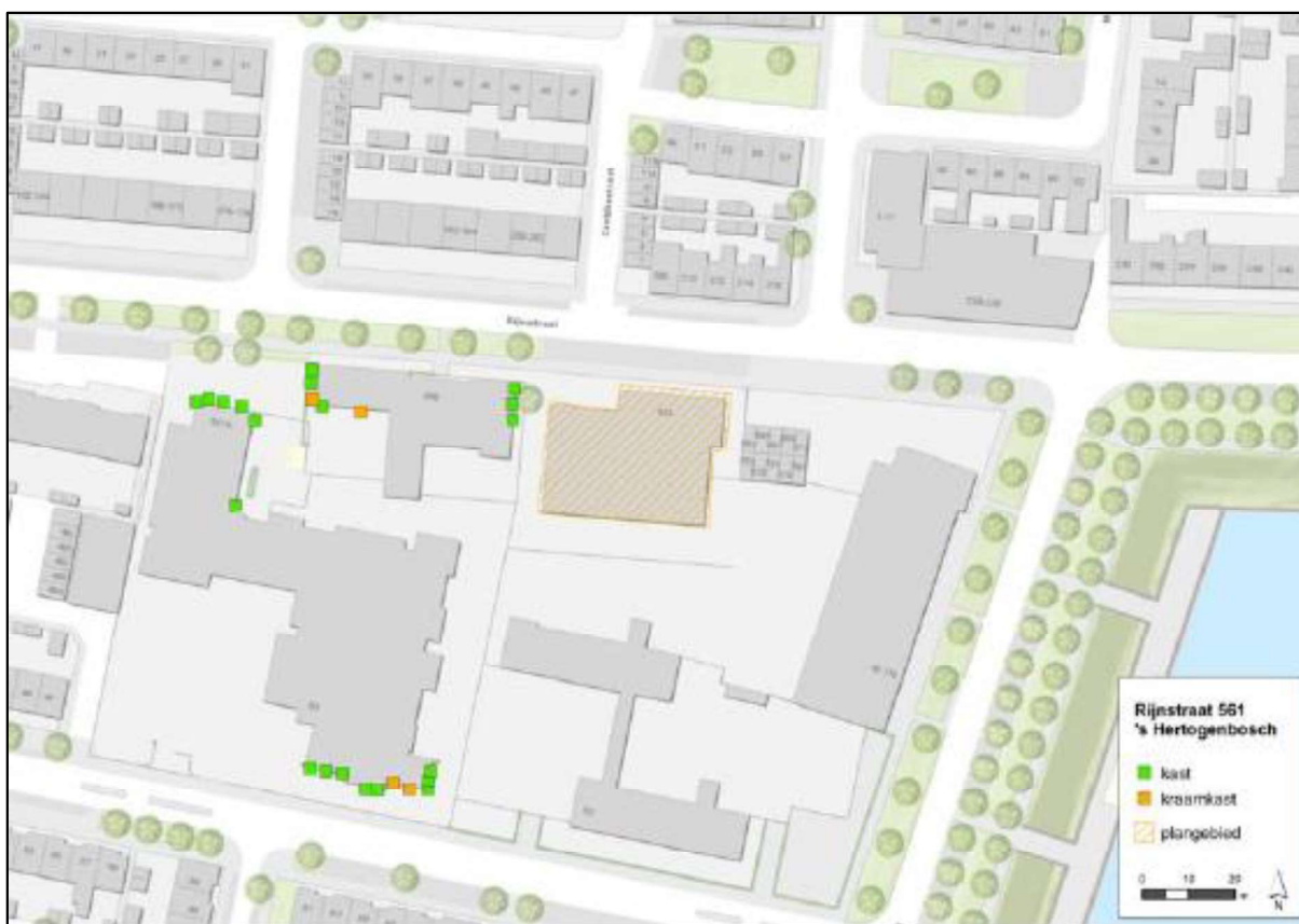
Figuur 2. Locaties van de tijdelijke voorzieningen.