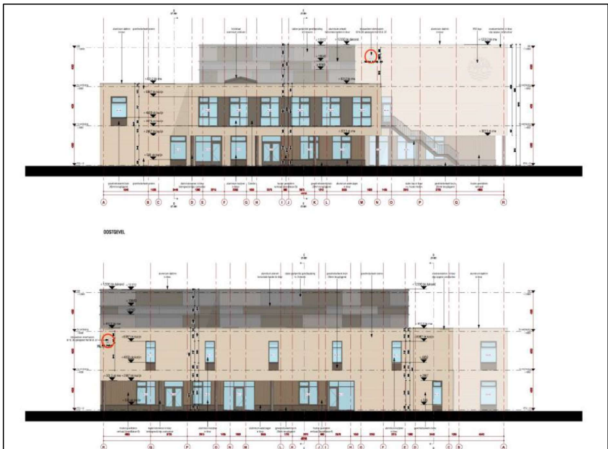
Figuur 3. Locaties van de permanente voorzieningen op de locatie van het nieuwe Kindcentrum ten zuiden van de huidige planlocatie.