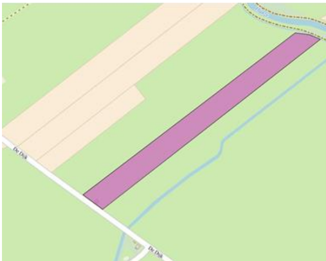
Figuur 1. percelen ontheffing

Wij hebben besloten op basis van onderstaande motivering aan u een ontheffing te verlenen op basis van artikel 3.3 van de Wet natuurbescherming (Wnb) voor het doden van grauwe- en kolganzen met behulp van geweer ter ondersteuning van de aangebrachte preventieve middelen vanaf één uur voor zonsopkomst ter voorkoming van belangrijke schade aan kwetsbare gewassen op de percelen uit uw aanvraag zoals weergegeven op onderstaande figuur 1.