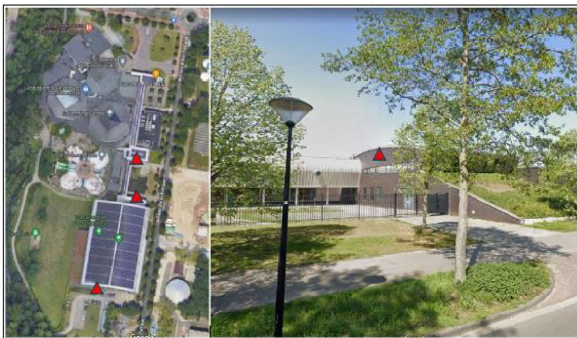
Figuur 3. Locatie van de permanente paarvoorzieningen.