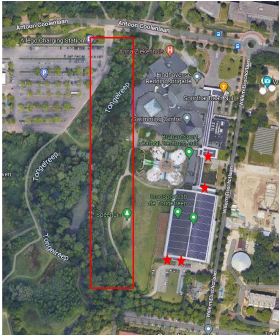
Figuur 2. Locaties van de tijdelijke vleermuiskasten. Rode ster = kraamverblijfplaats gewone dwergvleermuis, rode rechthoek = zone waarin kasten voor de paarverblijfplaats zijn opgehangen aan bomen.