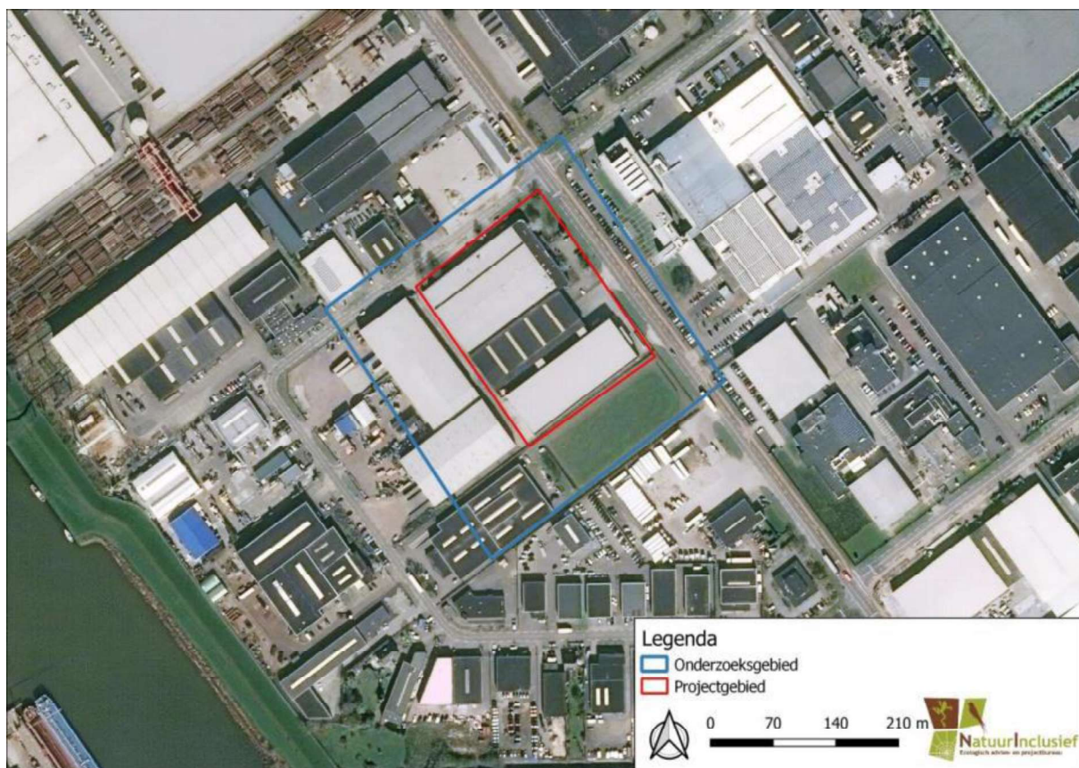
Figuur 1. Locatie Zalmweg 27, 4941 VX te Raamsdonksveer. De activiteiten vinden plaats binnen het rood omlijnde gebied.