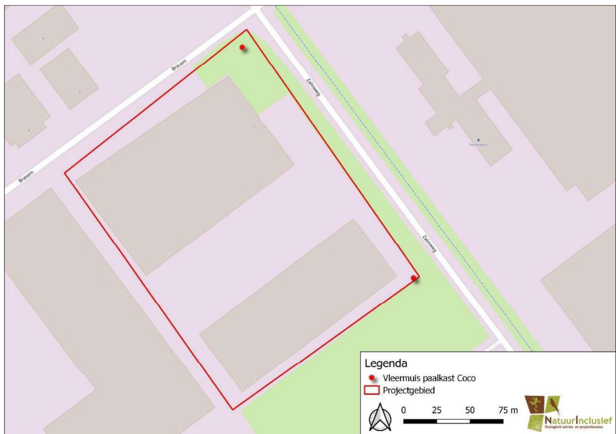
Figuur 2. Locatie van de tijdelijke voorzieningen voor de huismuis (bovenste) en gewone dwervleermuis (onderste).