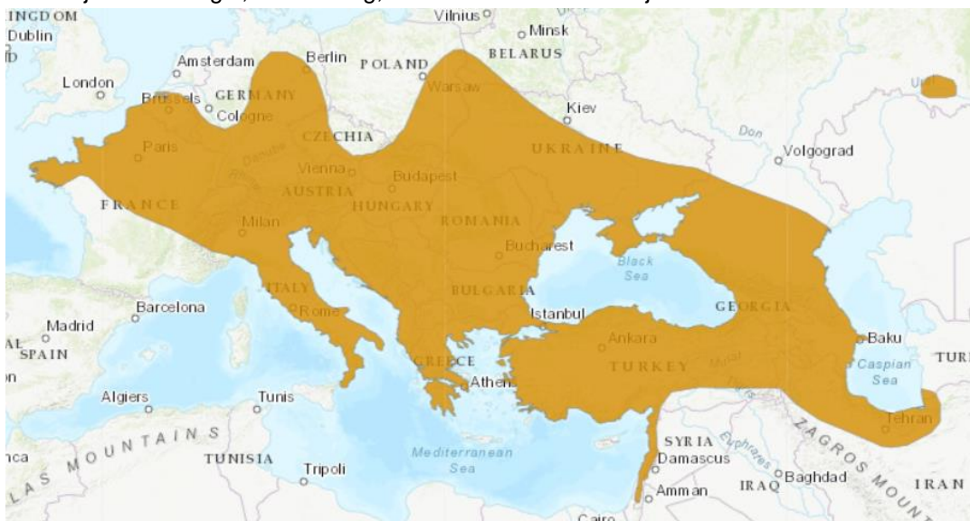
Figuur 2. Verspreidingsgebied veldspitsmuis

Het verspreidingsgebied van de veldspitsmuis ligt in grote delen van Midden-Europa. In West-Europa komt hij voor in België, Luxemburg, het noorden van Frankrijk en het westen van Duitsland.