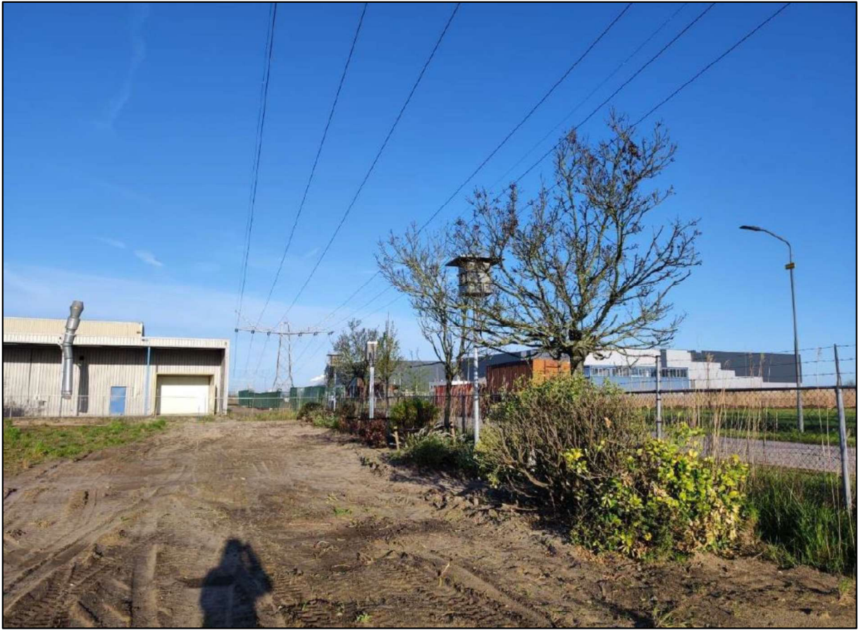
Figuur 3. Locatie van de tijdelijke voorzieningen bestaande uit 2 huismusmuistillen met elk 24 nestlocaties en een groenstrook aangeplant aan de noordzijde van het terrein aan Dwarsweg 3 te Waspik. Deze voorzieningen worden, naast de realisatie van de 24 huismuskasten aan de oostgevel van de nieuwbouw, in de nieuwe situatie gehandhaafd.