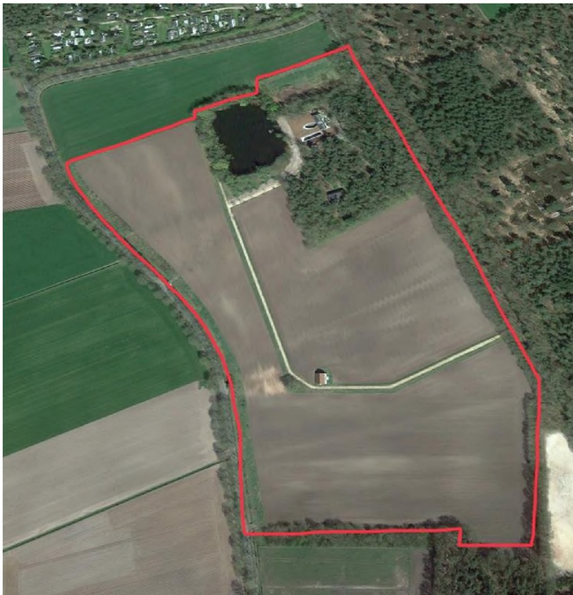
Figuur 1 Projectgebied (begrenst met rode lijn)

Het plangebied ligt aan de Kerkweg in Nispen. De initiatiefnemer is van plan om in het 15 hectare grote plangebied van het landgoed “Gienderwijte” natuur te ontwikkelen in combinatie met de aanleg van waterinfiltratiebekkens, een paddenpoel en het vergroten van de zoetwaterplas. Een en ander in afstemming met het waterschap Brabantse Delta. Daarvoor zal ca 11,5 ha landbouwgrond omgezet worden naar nieuwe natuur en toegevoegd worden aan het NNB (Natuur Netwerk Brabant). Het gebied was vroeger onderdeel van een heidegebied dat kort na 1945 is ontgonnen en omgezet naar landbouwgrond. Daarbij is destijds een 2 meter dik zandpakket verwijderd voordat de bouwvoor werd aangebracht.