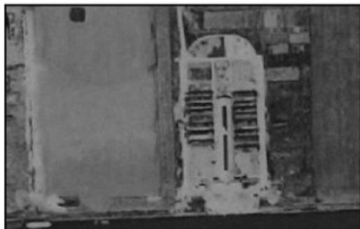
Figuur 1: Luchtfoto 1949

Op het terrein (binnen de grenzen van de onderzoekslocatie) was vanaf 1949 een werkkamp gevestigd (zie figuur 1). Op het terrein is vanaf 1970 een autowrakken terrein geregistreerd. In 1983 zijn de activiteiten demontagebedrijf van auto's e.d. en jachtwerf (winterberging, reparatie, etc.) hier gestart. Op figuur 2 is de huidige situatie te zien.