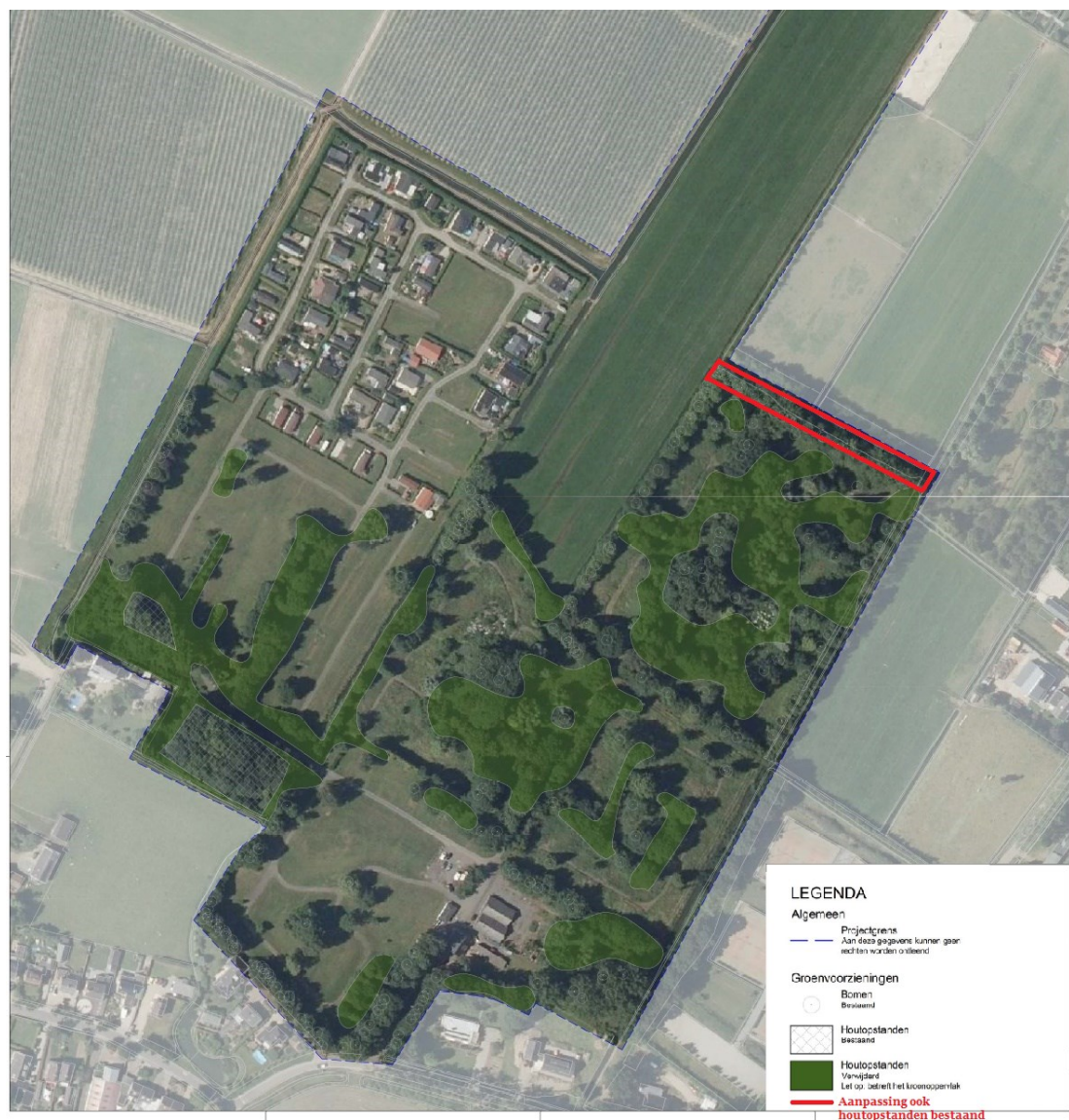
Figuur 1: Verwijderde houtopstanden en de bestaande houtopstanden (vóór de velling)