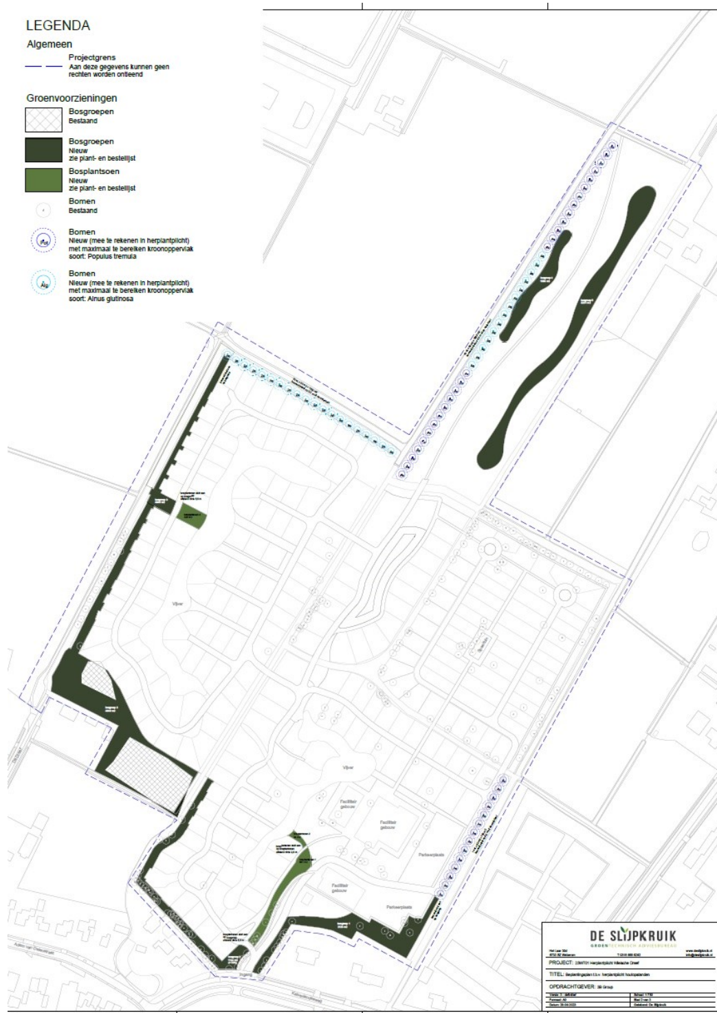
Figuur 2: Nieuw aan te planten houtopstanden, in het kader van de herplantplicht