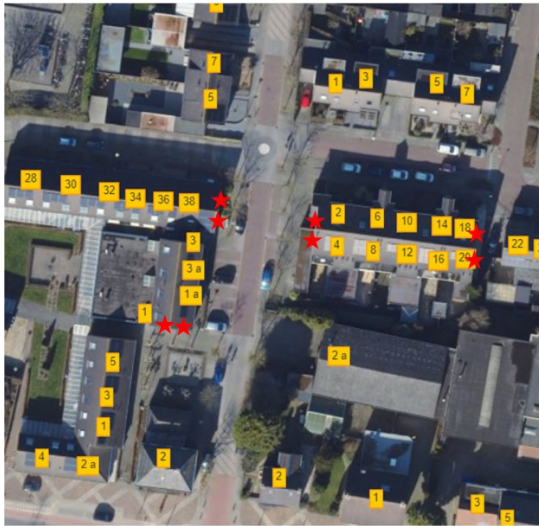
Figuur 3 Locaties van de tijdelijke voorzieningen voor de gewone dwergvleermuis. (De locaties van de tijdelijke kraamkasten worden nog aangeleverd.)