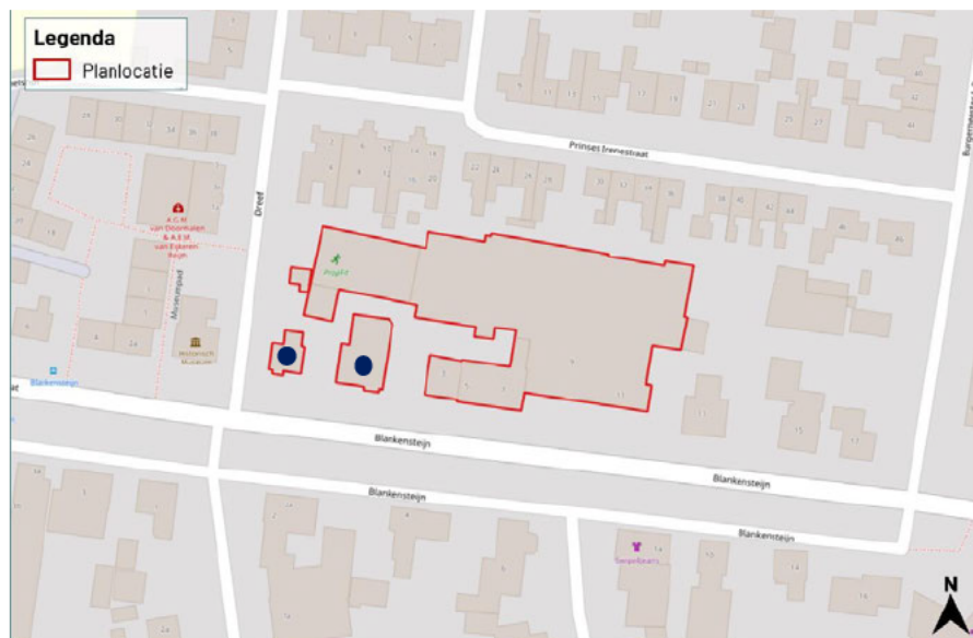
Figuur 1. Projectgebied (rood omkaderd). De gebouwen met donkere stippen zijn nog niet gesloopt.