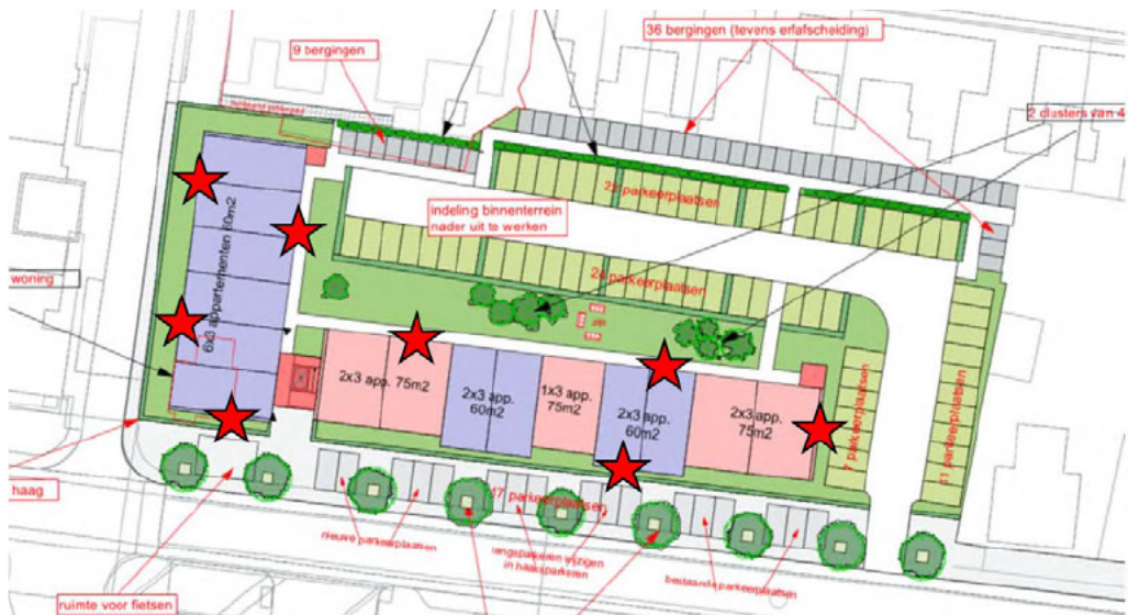
Figuur 2 Nieuwe situatie van het projectgebied. Rode sterren geven de locaties van de permanente voorzieningen voor de gewone dwergvleermuis weer. (Alternatieve kraamverblijfplaatsen wordt ter goedkeuring aan ons voorgelegd.)