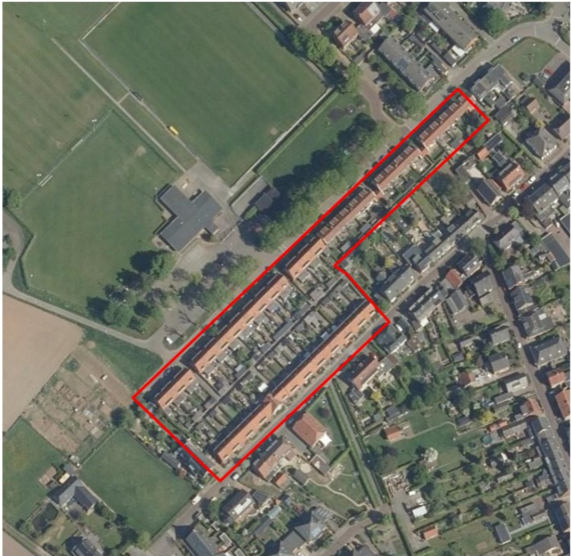
Figuur 1 Het plangebied betreffende complex 248 en 249 aan de Molenweg en Baankstraat in Zutphen met daarbinnen de te slopen woningen is met een rode lijn omkaderd.