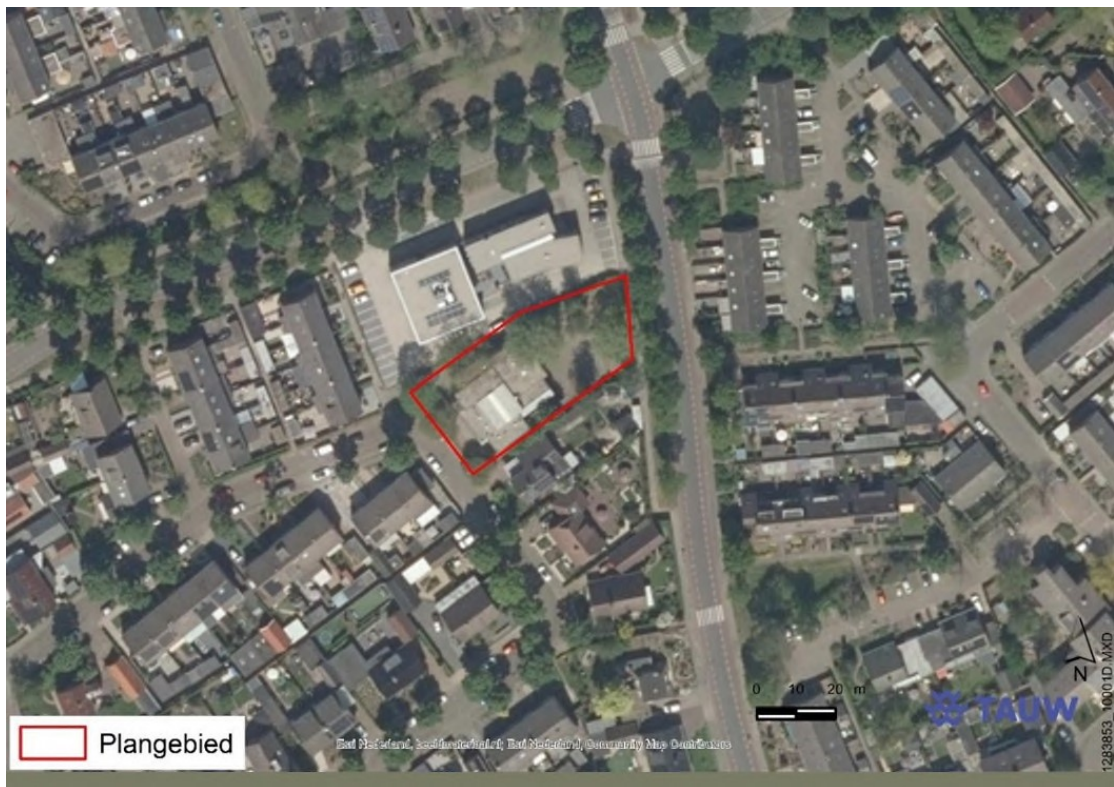
Figuur 2. Luchtfoto projectgebied.