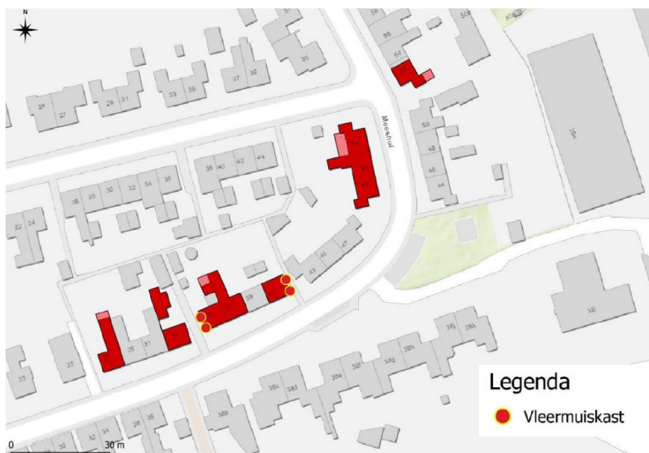
Figuur 4. Overzicht van de locaties van de permanente mitigerende maatregelen voor de gewone dwergvleermuis (rode stippen) binnen het plangebied (roodgekleurde woningen).