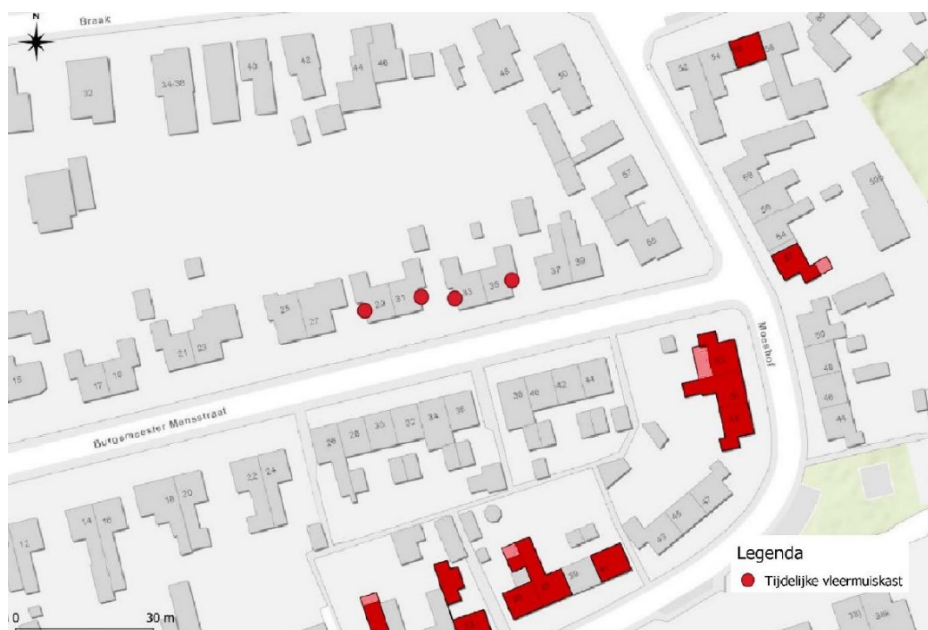
Figuur 3. Overzicht van de locaties van de tijdelijke mitigerende maatregelen voor de gewone dwergvleermuis (rode stippen) ten opzichte van het plangebied (roodgekleurde woningen).