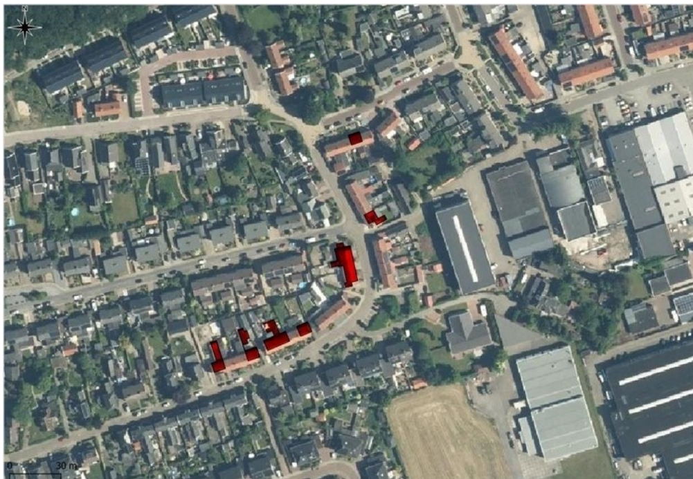
Figuur 2: Luchtfoto van het plangebied. De tot het plangebied behorende woningen zijn op de foto in rood aangeduid.