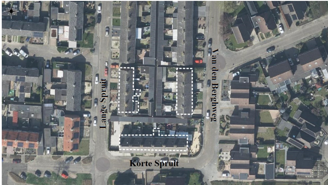
Figuur 1: Indruk van het projectgebied (witte stippellijn): Korte Spruit 29 tot en met 39, Lange Spruit 14 tot en met 20 en Van den Berghweg 30 tot en met 36 te Didam.