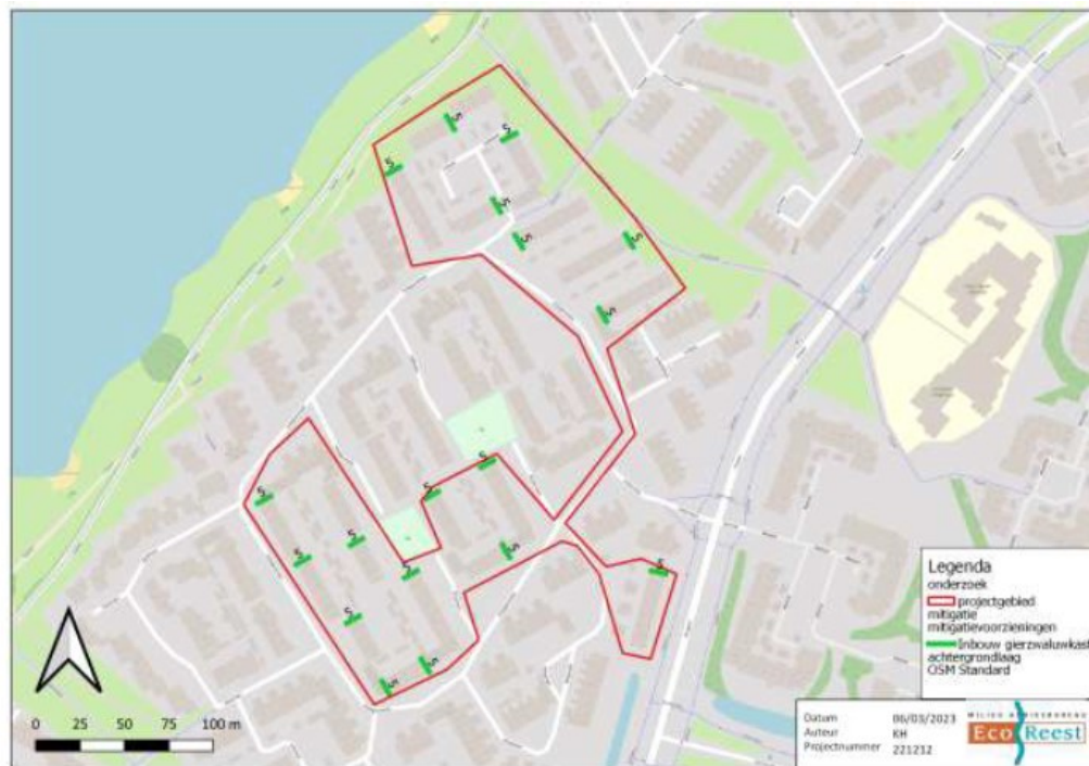
Tabel 5.2 Overzicht te realiseren inbouw gierzwaluwkasten