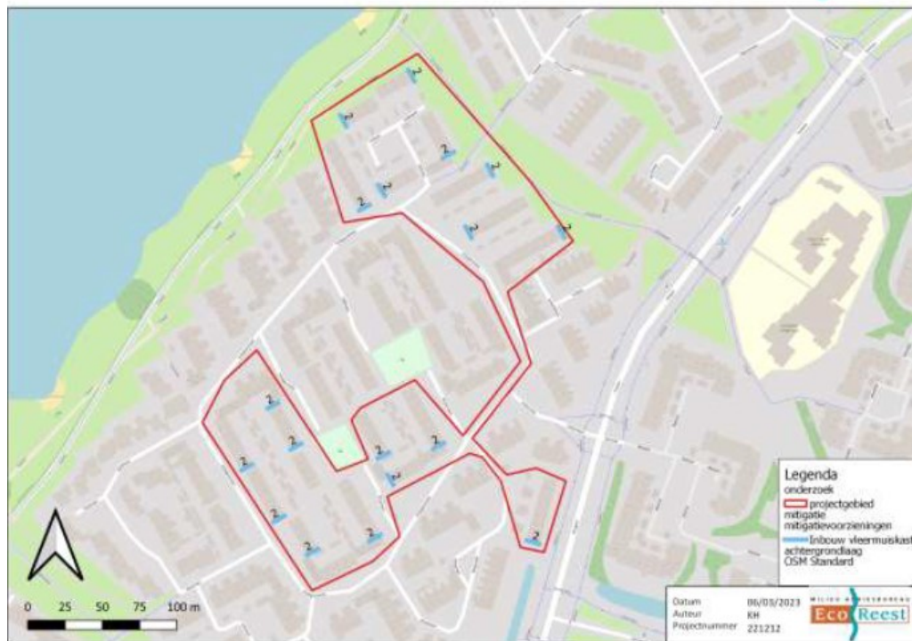
Tabel 5.1 Overzicht te realiseren inbouwvleermuiskasten