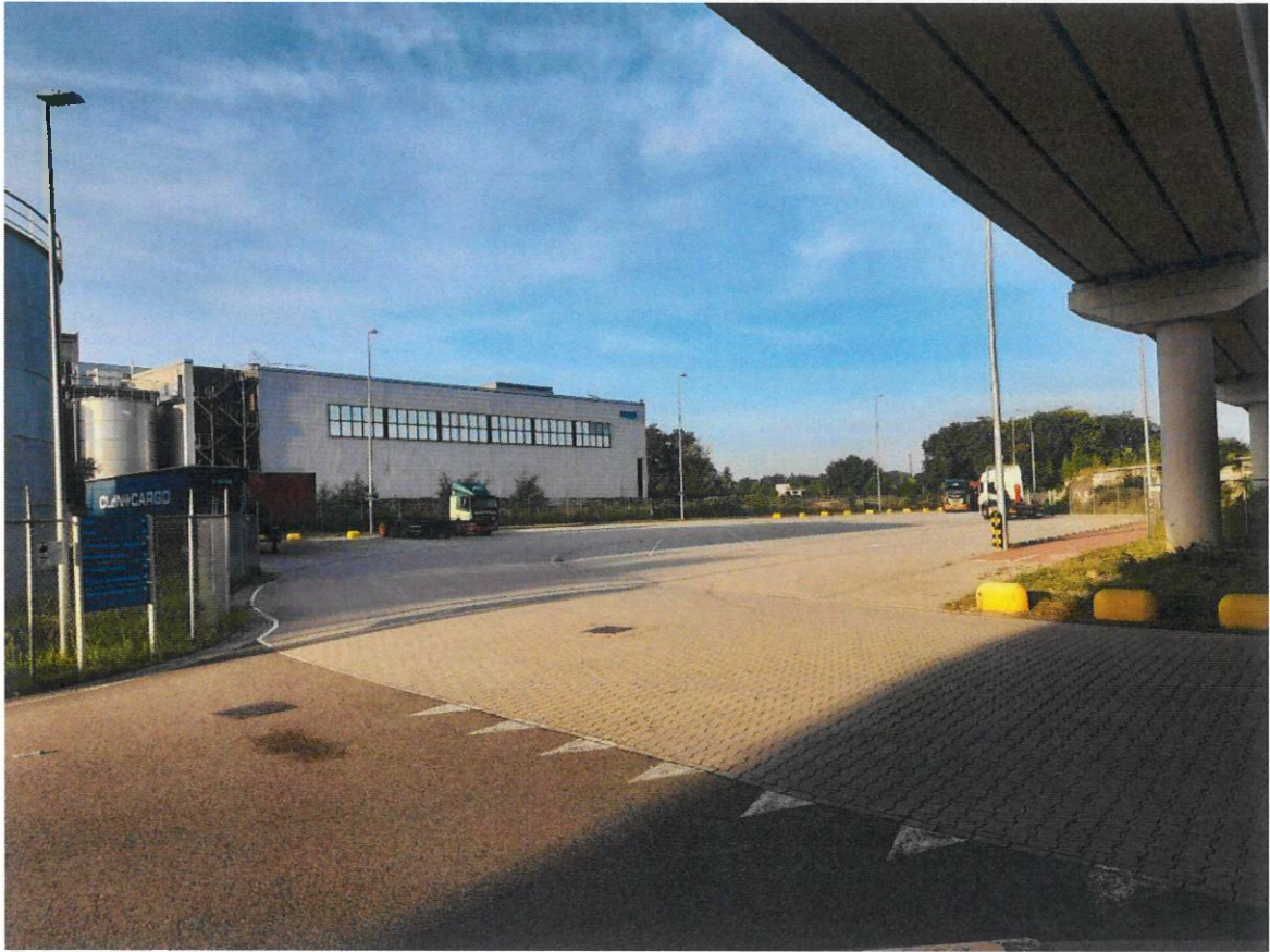
Parkeerplaats P3 en P4