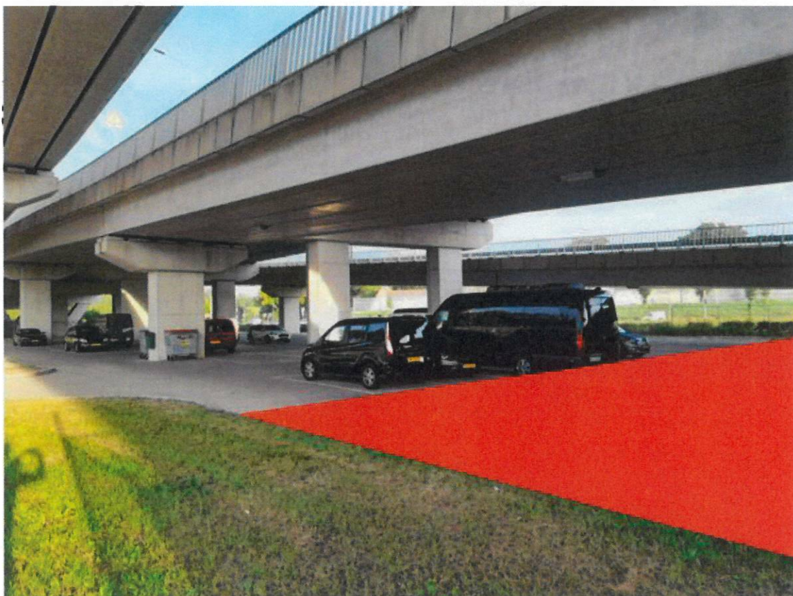
Parkeerplaats P1 en een deel van de fietsenstalling in rood weergegeven