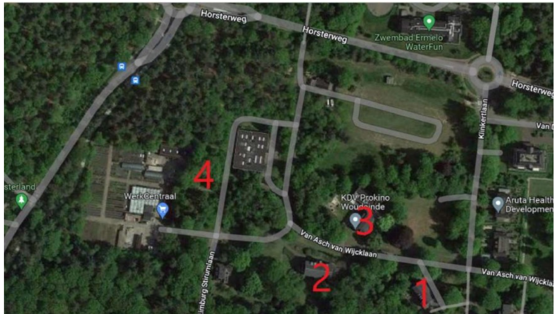
Figuur 2 Locaties (rode getallen) en aantallen tijdelijke verblijfplaatsen (vleermuiskasten) gewone dwergvleermuis aan de Van Limburg Stirumlaan (ong.) en Van Asch van Wijcklaan (ong.) te Ermelo. Locatie 1 (Berkenhof) 6 kasten, locatie 2 (Vredenhof) 6 kasten, locatie 3 (Woudeinde) 2 kasten en locatie 4 (Reinwaterkelder) 2 kasten.