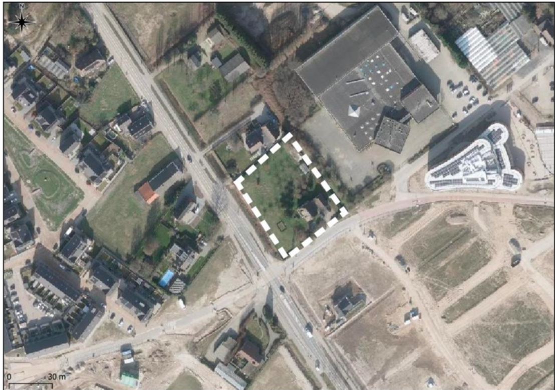
Figuur 1 Luchtfoto van het projectgebied (wit gestreept kader) aan de Grifdijk Noord 20 te Lent en directe omgeving.