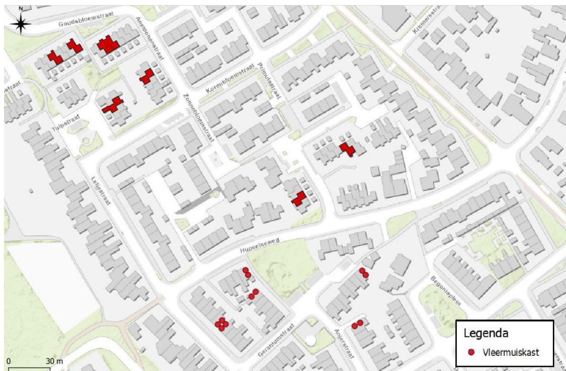
Figuur 4: Overzicht van de locaties van de tijdelijke mitigerende maatregelen (rode stippen) ten opzichte van het plangebied. In totaal moeten er in de omgeving 12 vleermuiskasten worden geplaatst. Afbeelding: Econsultancy 2023. Zie ook tabel 5 van bijlage 4 van dit besluit voor de exacte adressen.