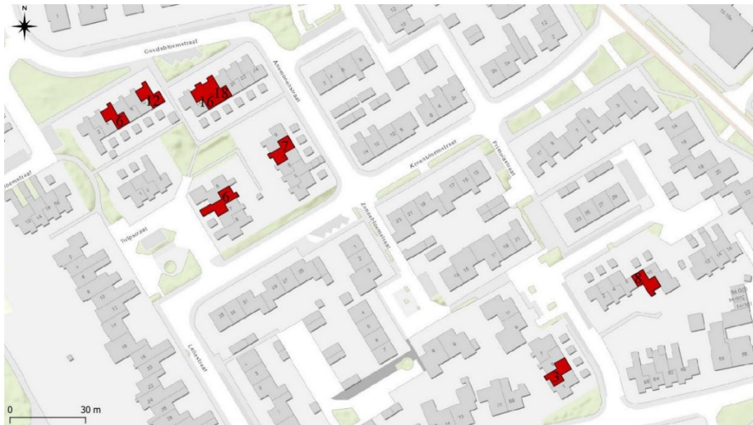
Figuur 2: Overzicht van het plangebied (roodgekleurde woningen, m.u.v. Goudsbloemstraat 12). Let op, Goudsbloemstraat 12 is op de kaart roodgekleurd, maar valt buiten de ontheffing omdat daar alleen werkzaamheden zullen worden uitgevoerd waarbij geen kans bestaat op overtredingen van de Wet natuurbescherming (zijnde dak isolatie van binnenuit de woning, nadrukkelijk géén spouwmuurisolatie).