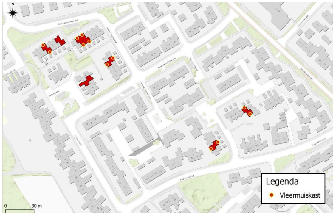
Figuur 5: Overzicht van de locaties van de permanente mitigerende maatregelen (rode stippen). In totaal moeten er binnen het plangebied 12 vleermuiskasten worden ingebouwd. Afbeelding: Econsultancy 2023.