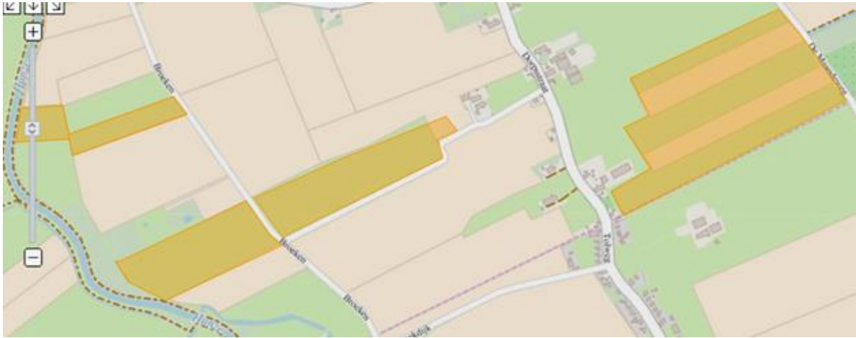
Figuur 2. percelen ontheffing overjarig grasland

Uw aanvraag voor het doden van Nijlganzen wijzen wij, op basis van onderstaande motivering, af.