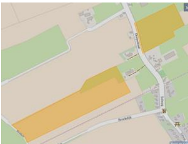
Figuur 1: percelen ontheffing ingezaaid grasland

Wij hebben besloten op basis van onderstaande motivering aan u een ontheffing te verlenen op basis van artikel 3.3 van de Wet natuurbescherming (Wnb) voor het doden van grauwe ganzen met behulp van geweer ter ondersteuning van de aangebrachte preventieve middelen vanaf één uur voor zonsopkomst ter voorkoming van belangrijke schade aan kwetsbare gewassen op de percelen uit uw aanvraag zoals weergegeven op onderstaande figuur 1 en 2.