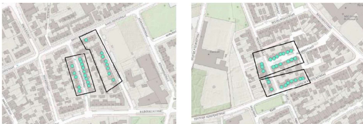
Figuur 1. Locatie huizencomplex 3089. De activiteiten vinden plaats binnen het omliggende gebied, aan de met groene stip aangegeven huizen.