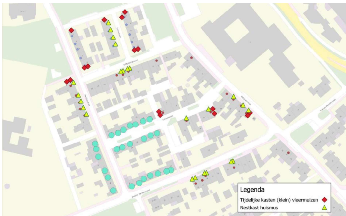
Figuur 3. Locatie van de tijdelijke voorzieningen bij Boxmeer Zuid.