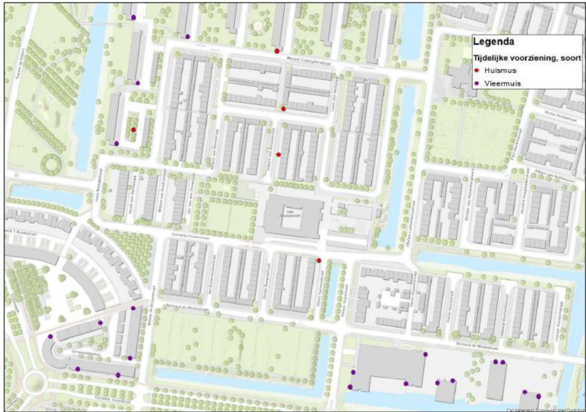
Figuur 2. Locatie van de tijdelijke voorzieningen.