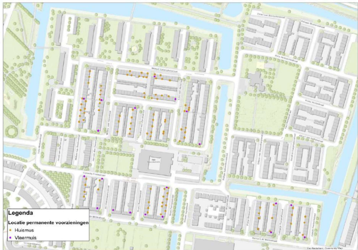
Figuur 3. Locatie van de permanente voorzieningen.