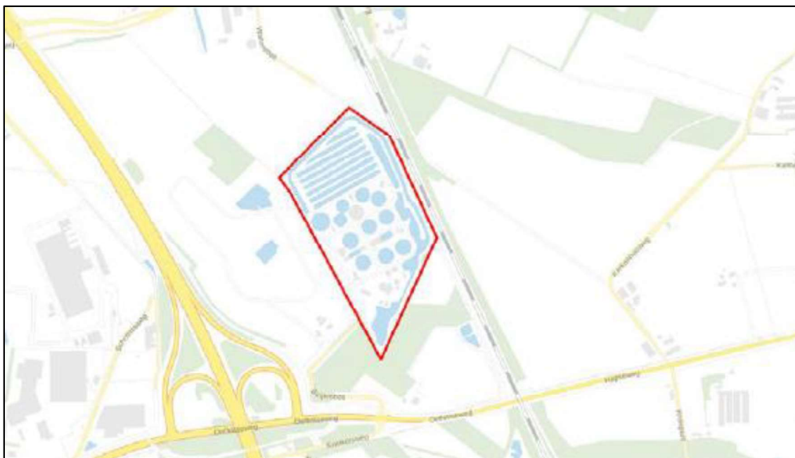
Figuur 1. Locatie Rioolwaterzuivering te Haps. De locatie is gelegen aan het Beijersbos 4 Te Haps. De activiteiten vinden plaats binnen het omliggende gebied.