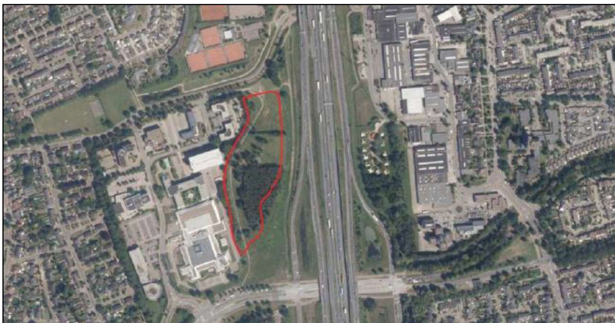
Figuur 1. Uitbreidingslocatie ASML. De uitbreidingslocatie ligt ten oosten van het huidige terrein van ASML, ten noorden van de Kempenbaan en ten westen van de N2/A2 in Veldhoven. De activiteiten vinden plaats binnen het omliggende gebied.