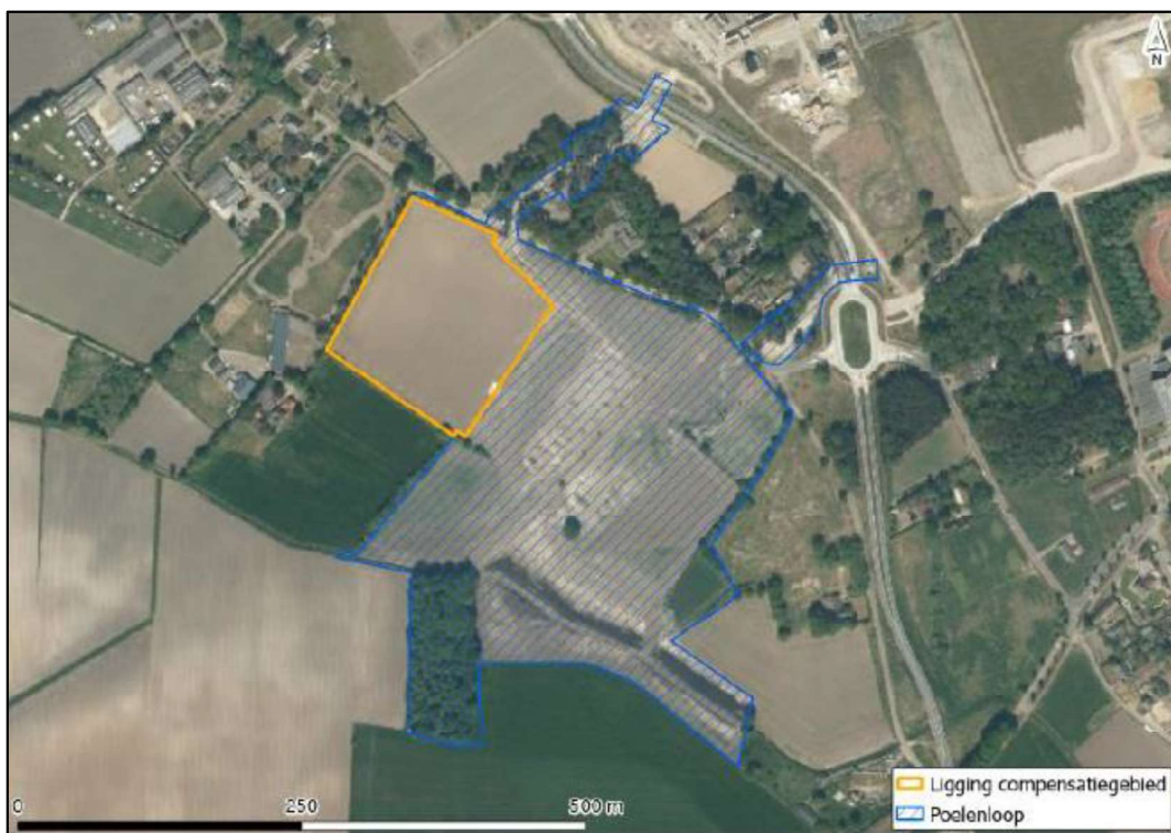
Figuur 3. Locatie van het compensatiegebied.