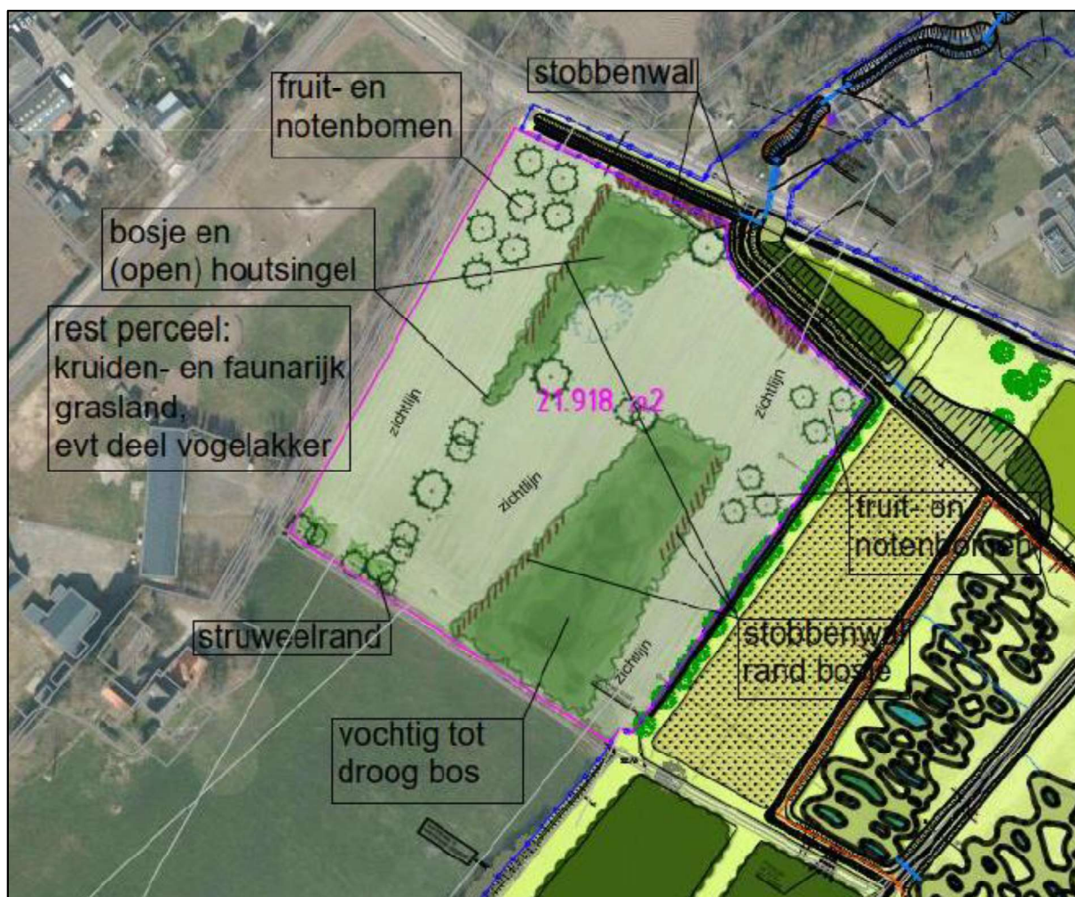
Figuur 4. Inrichting van het compensatiegebied.