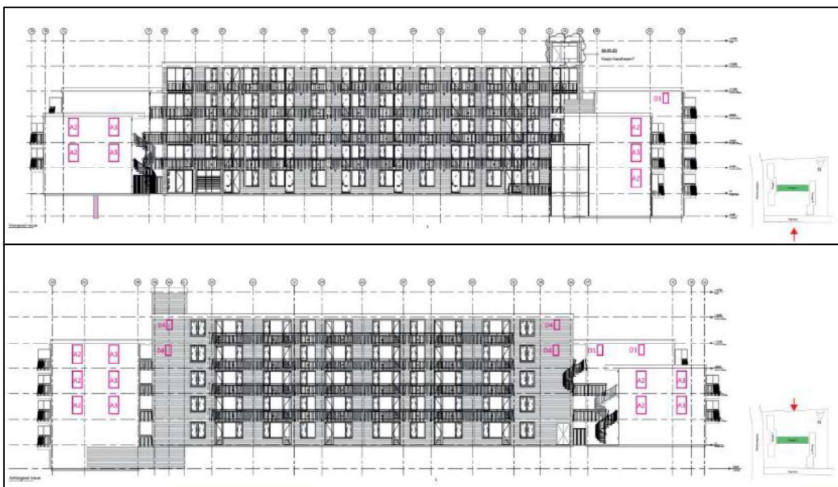
Figuur 1: De bovenste tekening weergeeft de noordzijde van het te verduurzamen appartementencomplex, aan de kant van de parkeerplaats. De onderste tekening weergeeft de zuidzijde van het te verduurzamen appartementencomplex, aan de kant van het parkje (alle kasten betreffen eenlaagse kasten, A2 en A3 hebben een afmeting van 200 centimeter (lengte) x 100 centimeter (breedte) x 3 centimeter (diepte), D1 en D4 hebben een afmeting van 100 centimeter (lengte) x 50 centimeter (breedte) x 3 centimeter (diepte)).