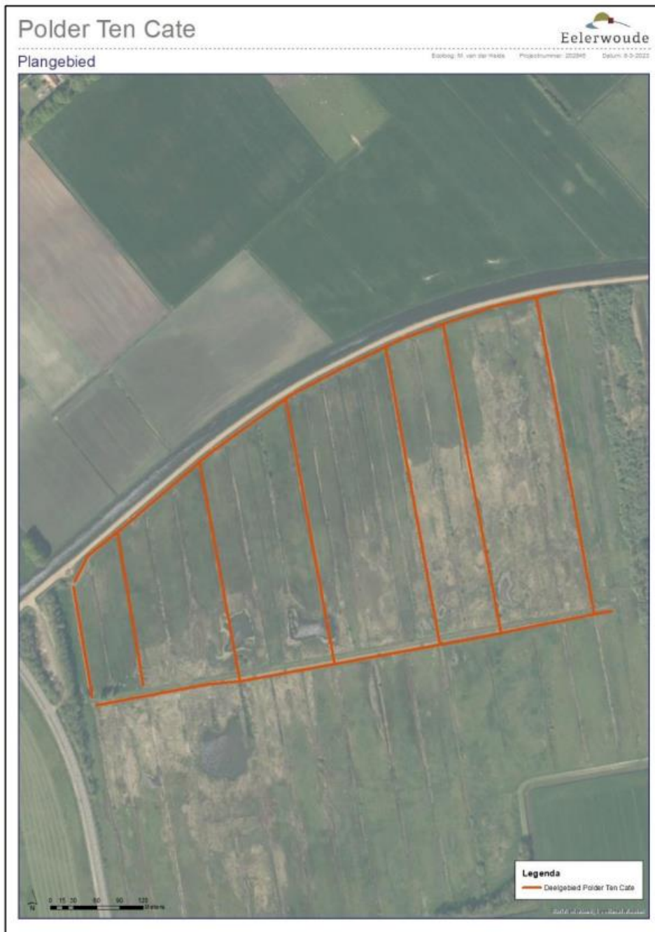
Figuur 1: Projectgebied (bron: Projectplan Wet natuurbescherming Grote modderkruiper d.d. 9 april 2023, door Eelerwoude)

Op 19 april 2023 hebben wij een aanvraag ontvangen voor een ontheffing van de Wnb van het Eelerwoude namens Staatsbosbeheer (hierna ontheffinghouder). De aanvraag heeft betrekking op het schonen, verondiepen en graven van watergangen, gelegen in Polder Ten Cate in de gemeente Westerveld. De ontheffinghouder heeft ontheffing aangevraagd voor de verbodsbepalingen genoemd in artikel 3.10 lid 1, sub a en b van de Wnb voor de grote modderkruiper ( Misgurnus fossilis ).