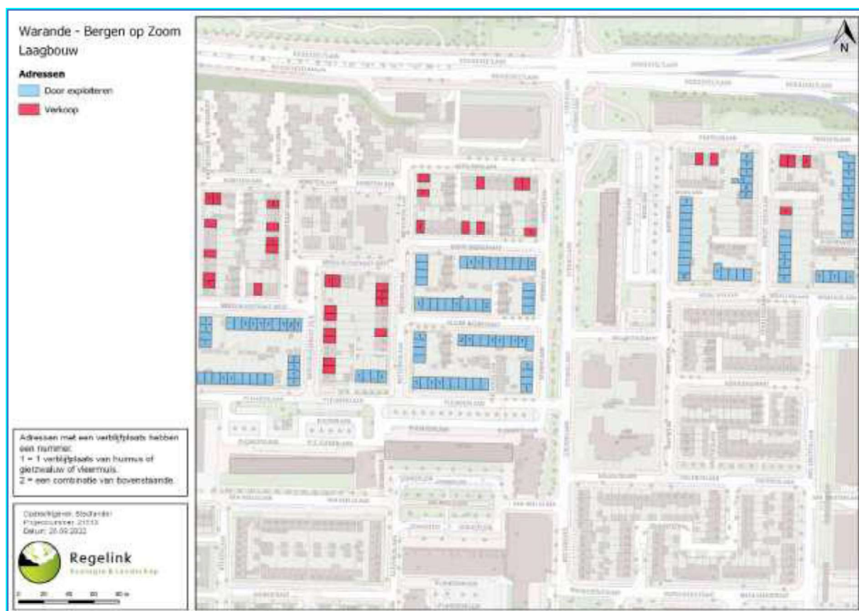
Figuur 1. Locatie wijk Warande-oost. De activiteiten vinden plaats op de rode en blauwe adressen.