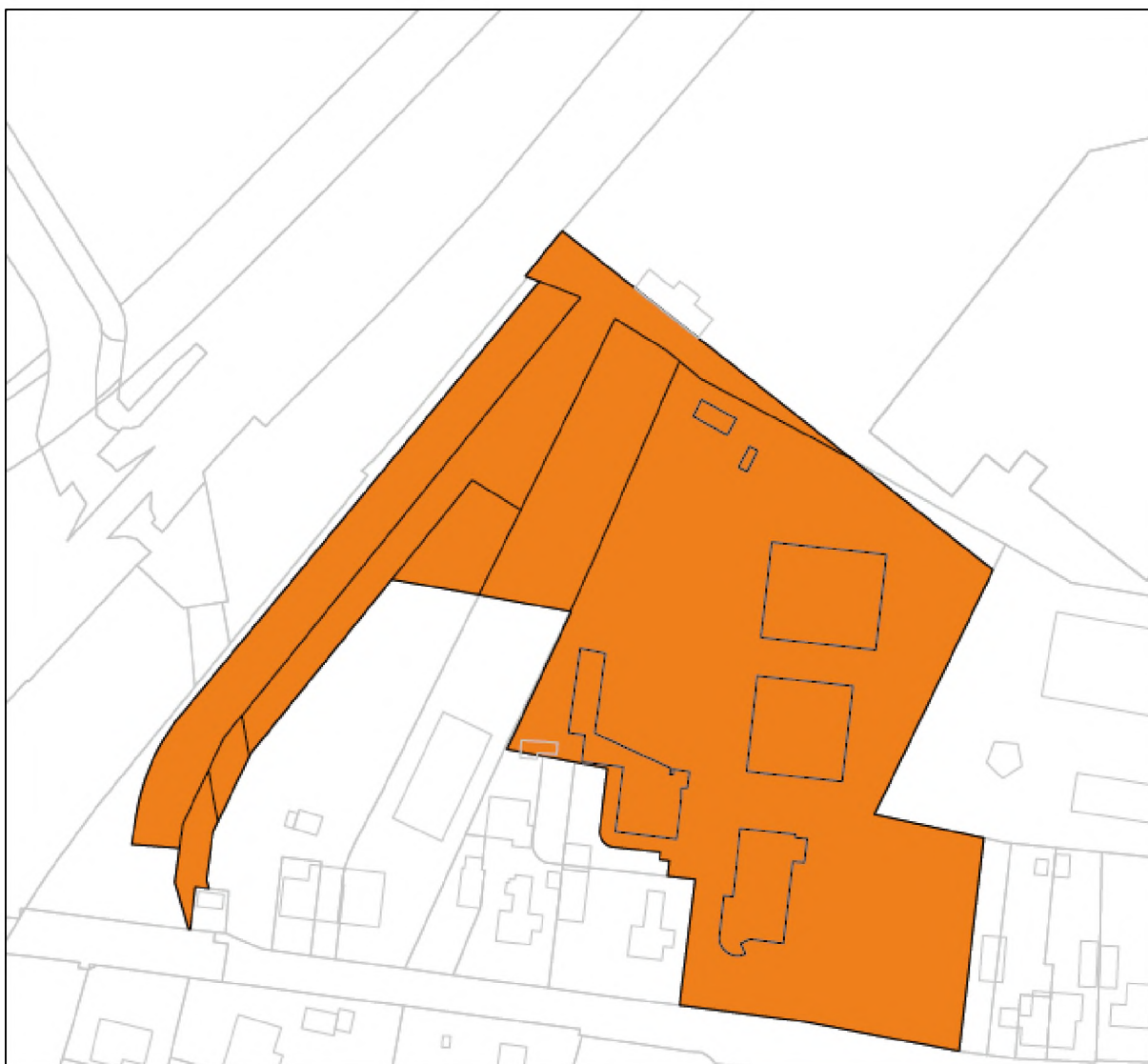
Figuur 2 Huidige inrichting Maanvak B.V.