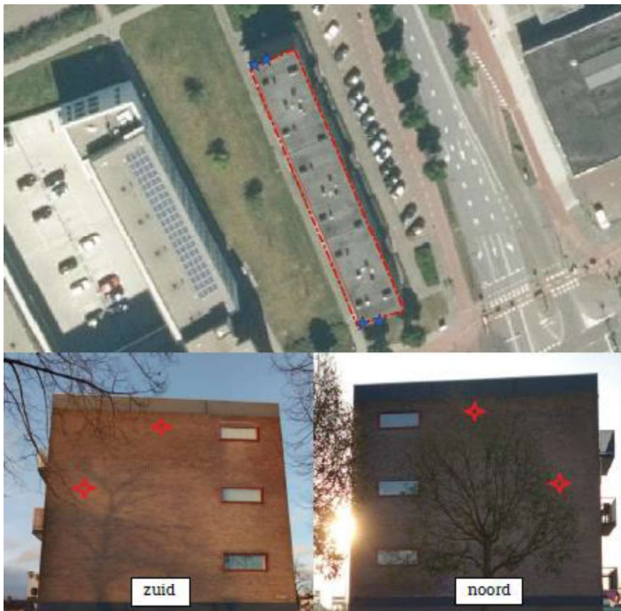
Figuur 2. Locatie van de mitigerende voorzieningen. Tijdens de werkzaamheden worden hier VMT2a kasten opgehangen van Unitura, naderhand worden op dezelfde locaties kasten die voldoen aan de voorschriften in deze ontheffing ingebouwd in het metselwerk.