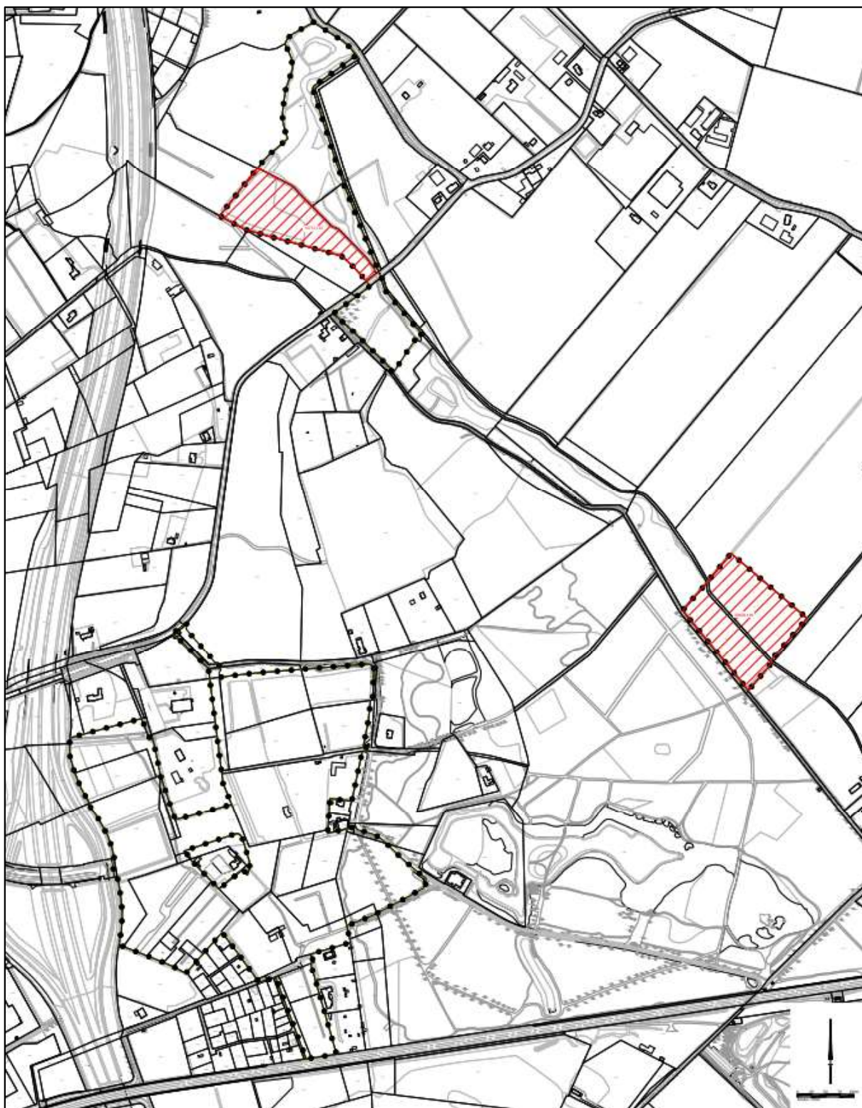
Figuur 2. Locaties van de compensatiegebieden (rood gearceerd).