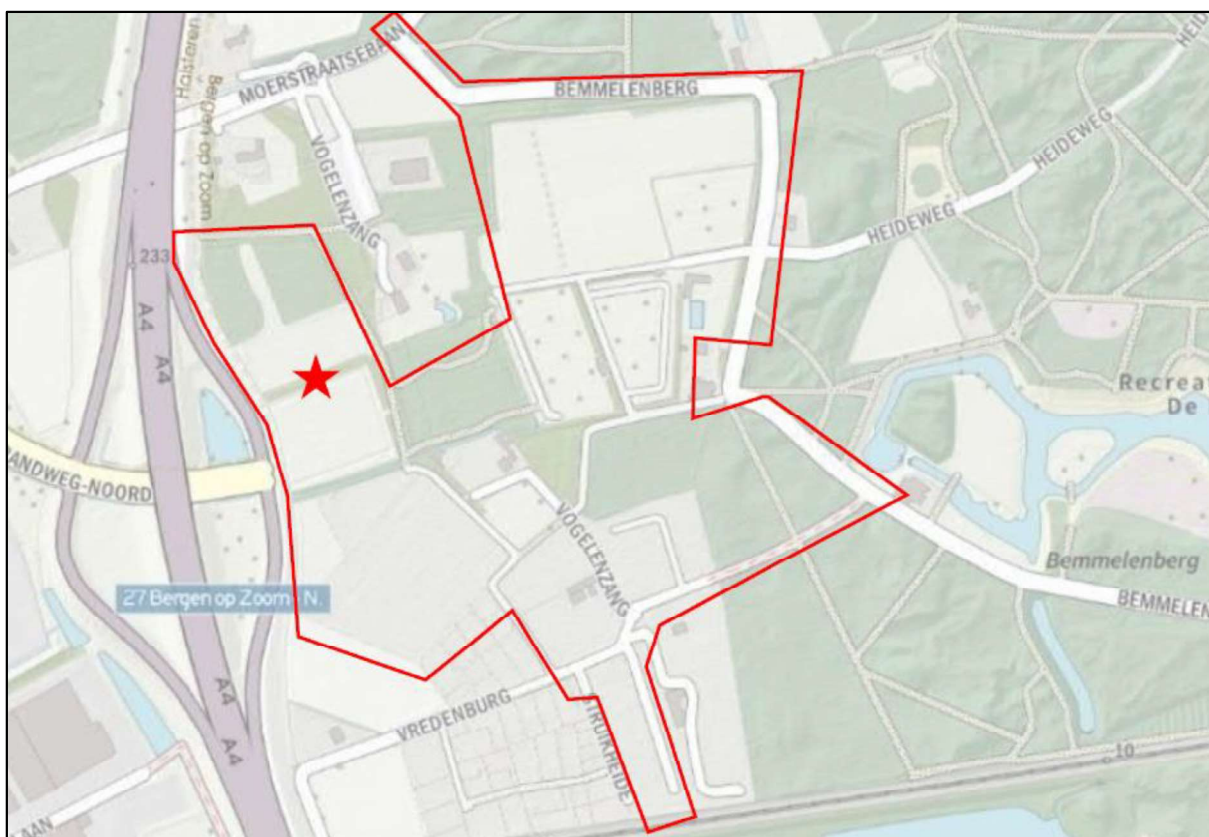
Figuur 1. Locatie Poortgebied Bergsche Heide. De activiteiten vinden plaats binnen het omlijnde gebied.