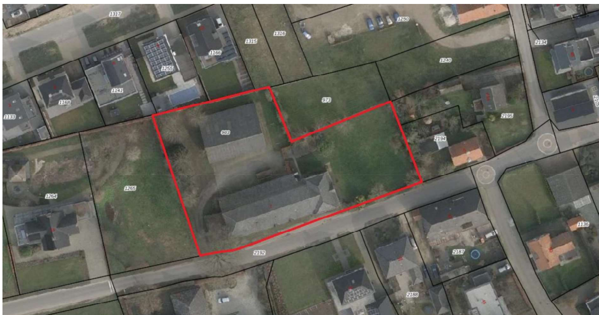
Figuur 1. Locatie Zandsteeg 7, 5836 AV te Sambeek, in de gemeente Land van Cuijk. De activiteiten vinden plaats binnen het omliggende gebied.