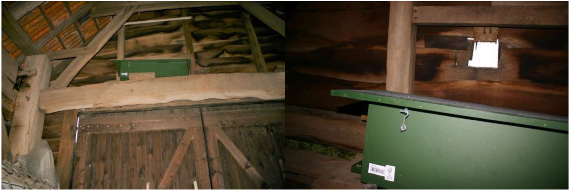
Figuur 2. De op 5 oktober 2022 opgehangen, eerste, permanente steenuilenkast in de schuur bij Zandsteeg 4.