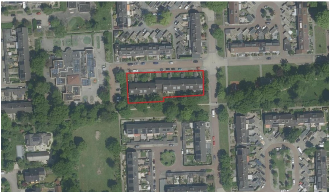
Figuur 1: Het plangebied (rood omkaderd), gelegen aan de Beverdam (even nummers) te Hoevelaken.