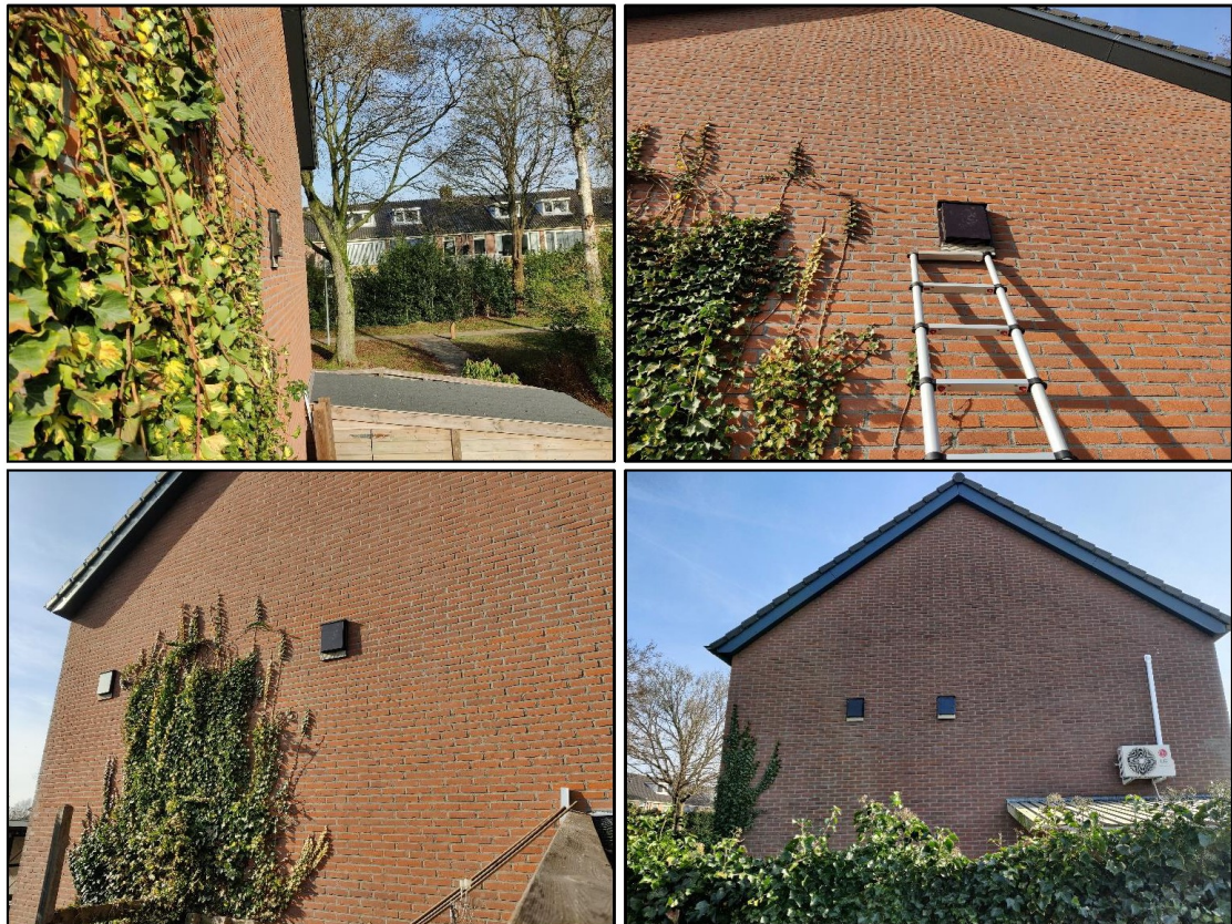
Figuur 4: Plaatsing van de 4 tijdelijke vleermuiskasten.