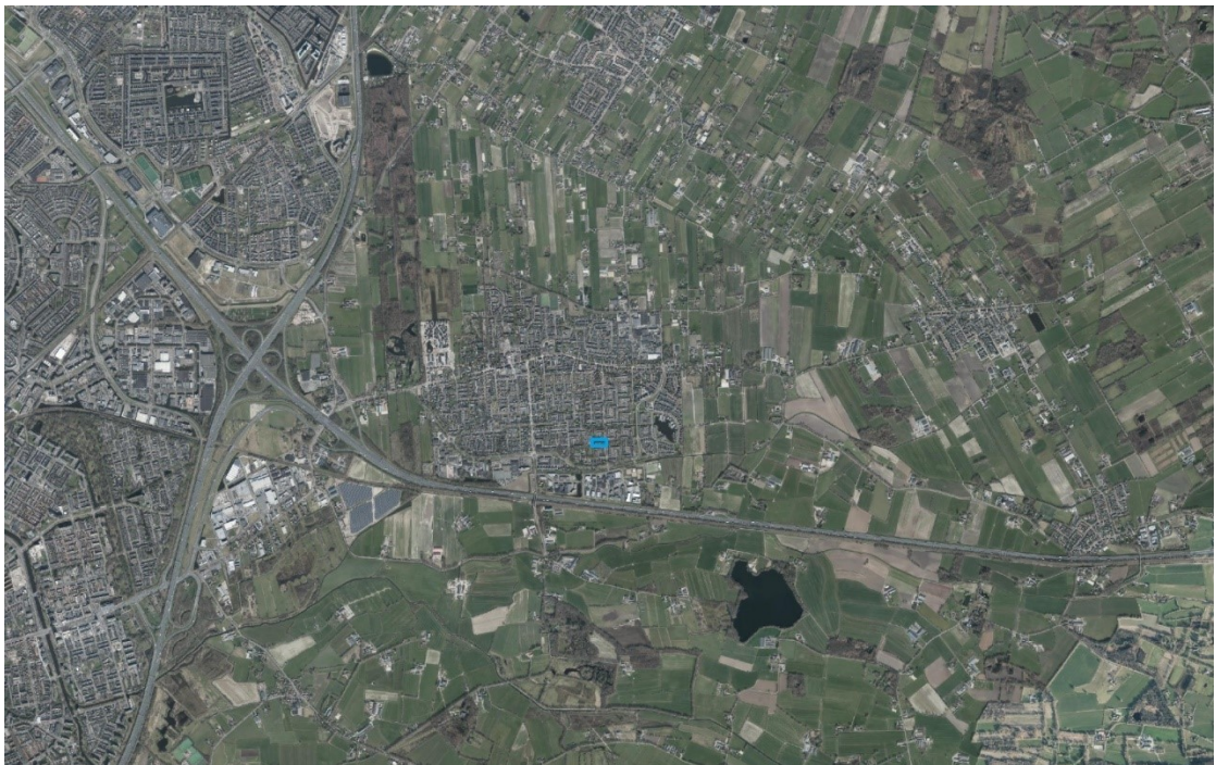
Figuur 2: Globale ligging van het plangebied (blauw).