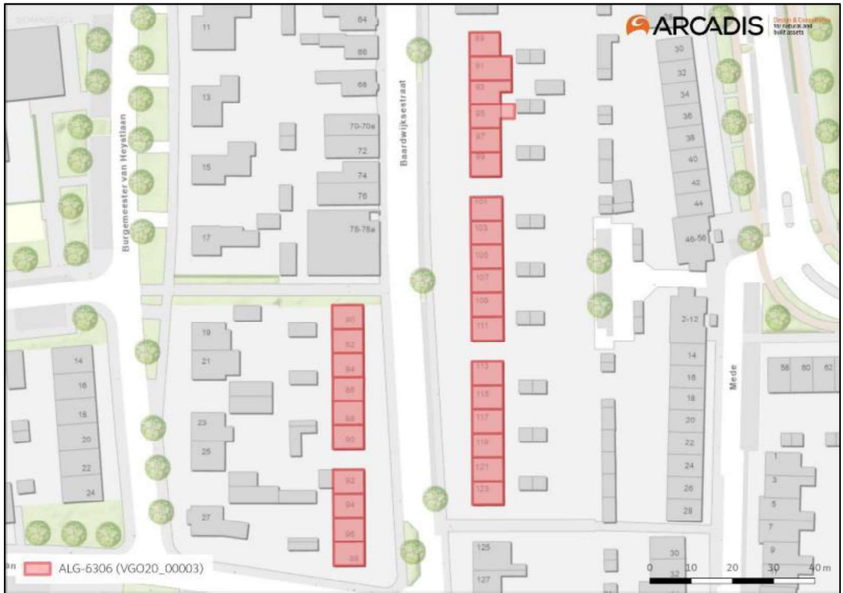
Figuur 1. Overzichtskaart werkzaamheden.