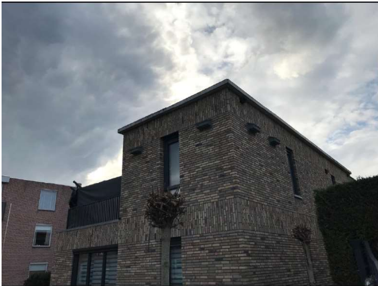
Figuur 2. Locatie van de tijdelijke voorzieningen.