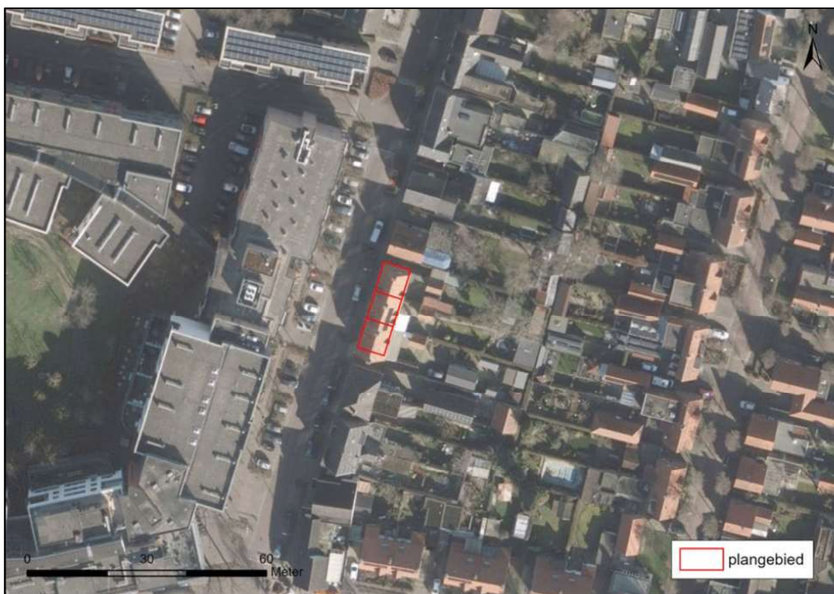
Figuur 1. Locatie Julianastraat 9, 11 en 13 te Gemert. De activiteiten vinden plaats binnen het omlijnde gebied.