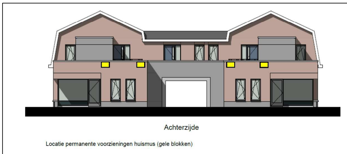
Figuur 3. Locatie van de permanente voorzieningen.