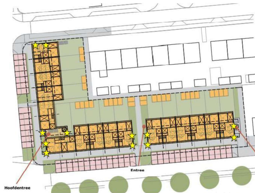
Figuur 8.9 Voorstel locaties te realiseren voorzieningen van 80 cm x 50 cm. Exacte locaties dienen later afgestemd te worden. De gele sterren geven de locaties aan (totaal 12x).