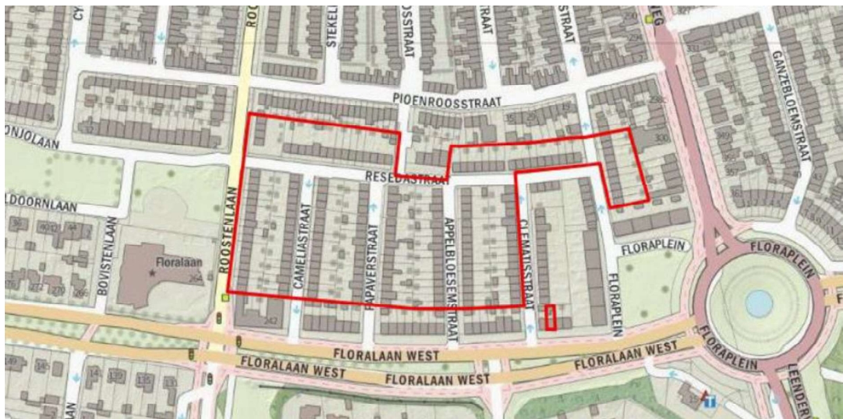
Figuur 1. Locatie Floraplein e.o. te Eindhoven. De activiteiten vinden plaats binnen het omlijnde gebied.