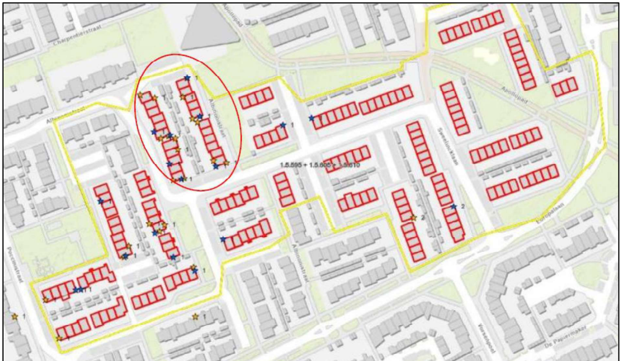
Figuur 3. Overzichtskaart aangetroffen huismusnesten