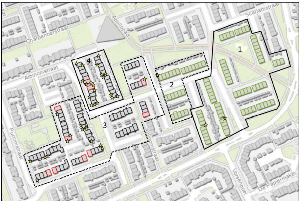
Figuur 4. Fasering werkzaamheden