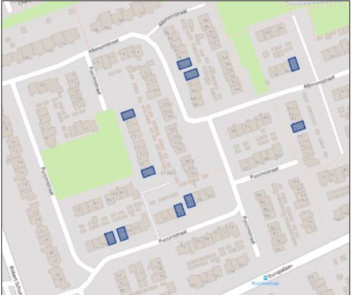
Figuur 2. Overzichtskaart werkzaamheden complex 1.5.610