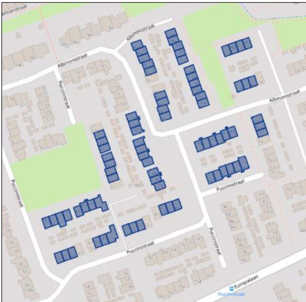
Figuur 1. Overzichtskaat werkzaamheden complex 1.5.605