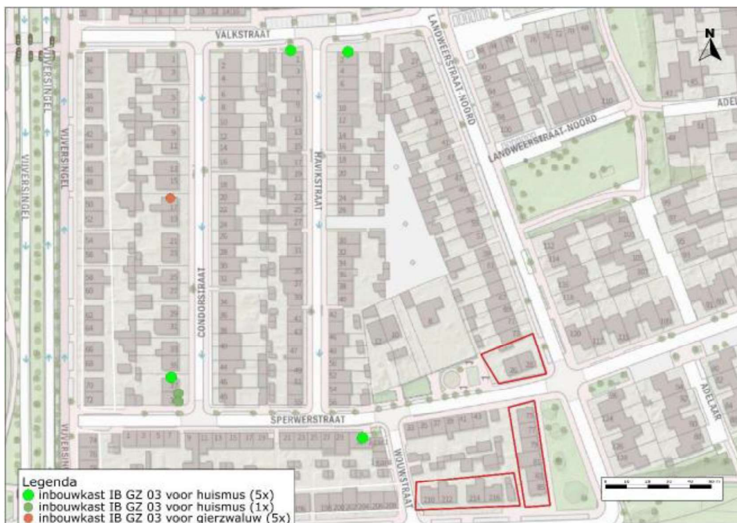
Figuur 2. Locatie van de tijdelijke voorzieningen. Dit is ook figuur 8.4 op pagina 16 van het activiteitenplan.