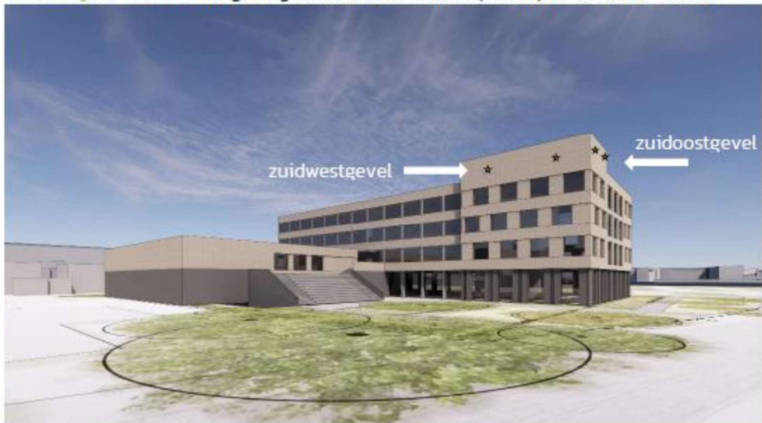
Figuur 3. Locatie van de permanente voorzieningen.