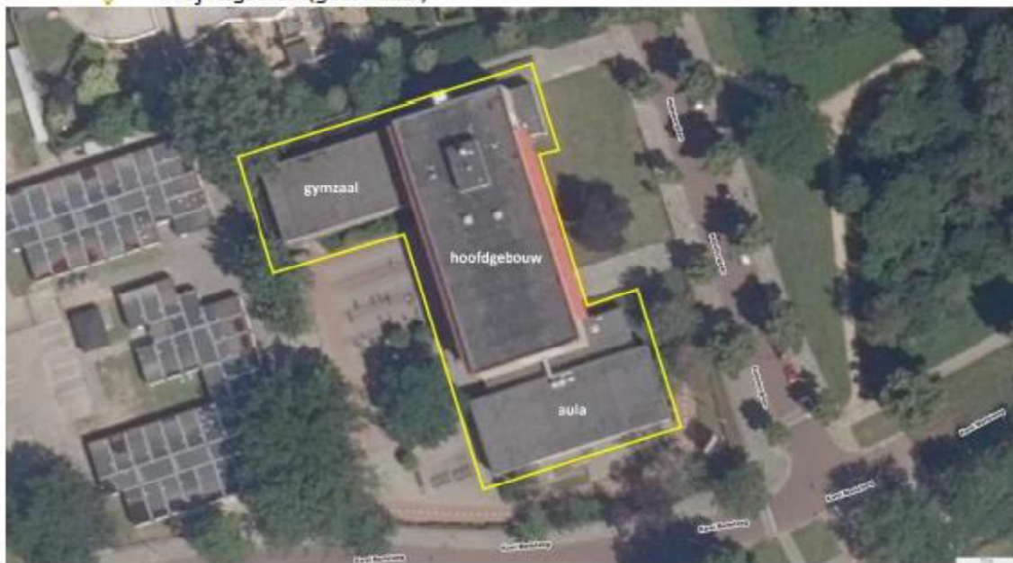
Figuur 1. Locatie Habsburglaan 1 in Eindhoven. De activiteiten vinden plaats binnen het omliggende gebied.